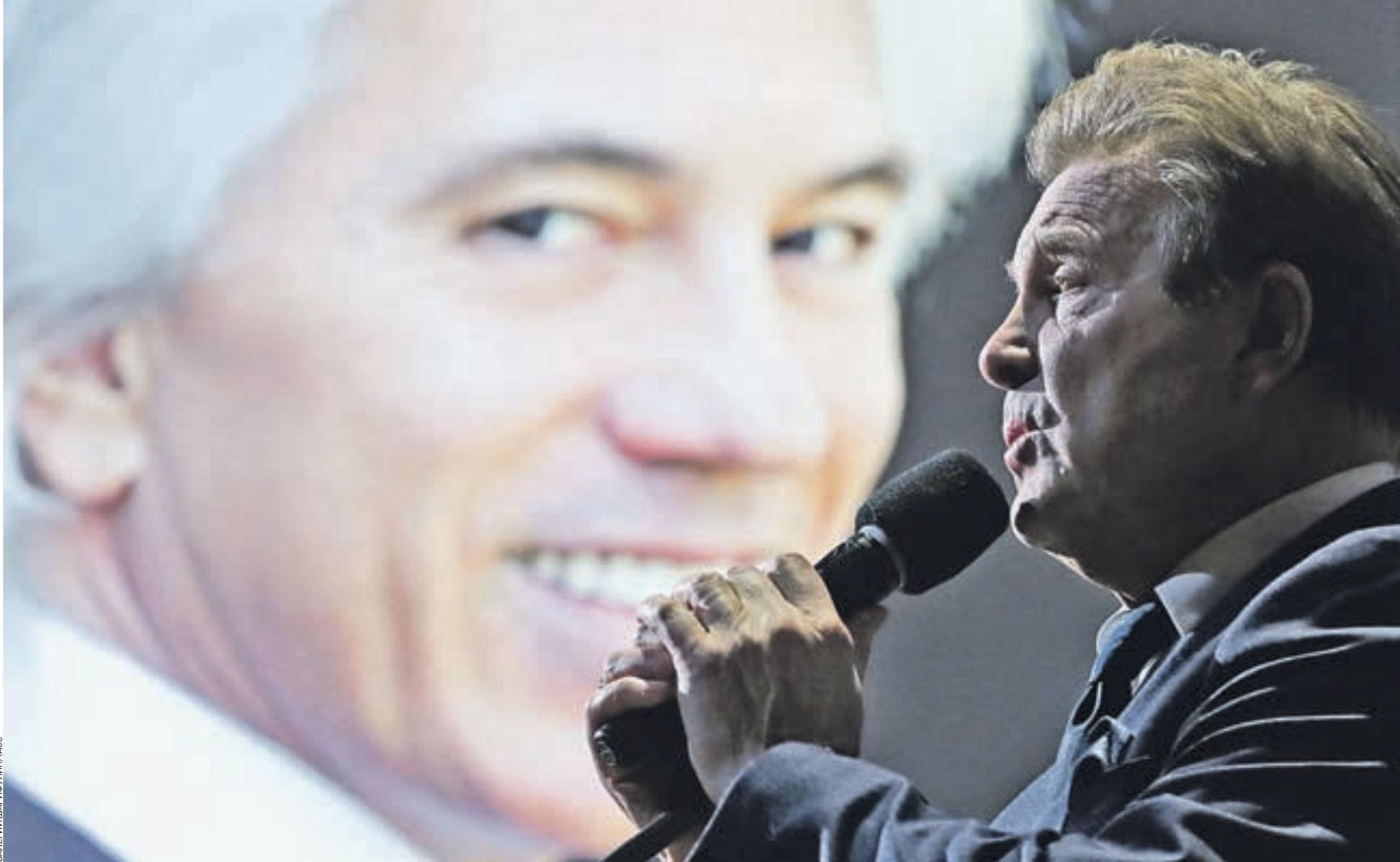
Вчера 11:25 Народный артист РСФСР Лев Лещенко также пришел на церемонию прощания с Дмитрием Хворостовским в Концертный зал имени Чайковского. Певец сказал несколько теплых слов в адрес коллеги и выразил соболезнования его родным, близким и многочисленным поклонникам

В числе первых возложить букет роз приходит эстрадный певец, депутат Госдумы Иосиф Кобзон. Он выражает сочувствие родным Дмитрием. — Творчество Хворостовского имело мировое значение, — присоединяется к соболезнованиям близкий друг певца, политический деятель Павел Астахов. — Но несмотря на это он всегда оставался русским человеком и был патриотом своей страны. Его последняя воля — разделить прах после кремации и одну часть оставить в Москве, а вторую — передать в Красноярск с соответствующими почестями. После согласования с семьей нами было принято решение, что такая передача произойдет сразу же после захоронения на Новодевичьем кладбище. Для многих поклонников искусства Дмитрий Хворостов-