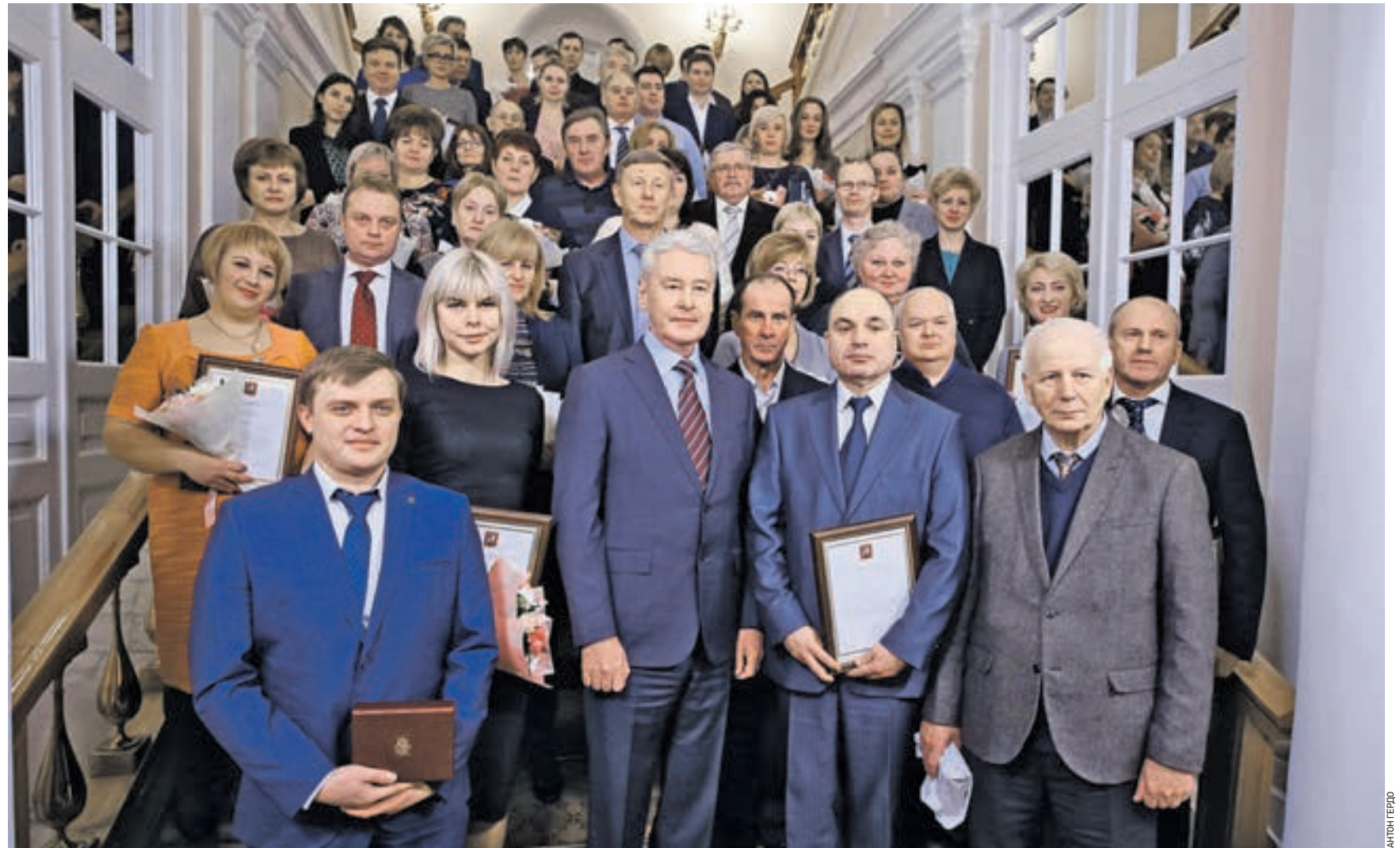
Вчера 14:30 Мэр Москвы Сергей Собянин (в центре) поздравил 54 работников столичной промышленности с городскими наградами. Памятный снимок сделали на Казанской лестнице в городской мэрии

Экспорт растет Промышленность не стоит на месте, она развивается. Как результат, экспорт произведенной московскими предприятиями продукции вырос на 38 процентов.