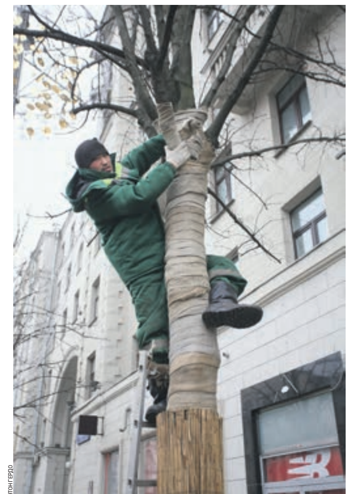
Вчера 14:31 Рабочий Атай Камчыбеков укутывает ствол дерева, чтобы защитить его от внешних воздействий

Деревья, высаженные на благоустроенных столичных улицах, в первые годы нуждаются в особой защите. В настоящее время их укутывают в специальные материалы.