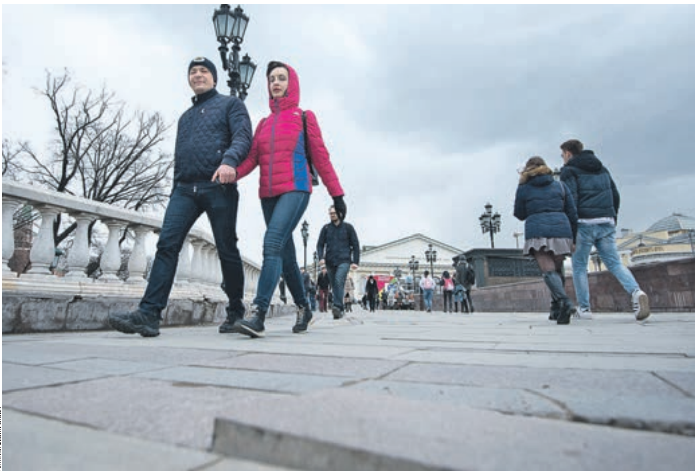
24 марта 17:27 Старая плитка на Манежной площади в некоторых местах от старости и капризов погоды уже начала приподниматься и ломаться, создавая неудобства для пешеходов.