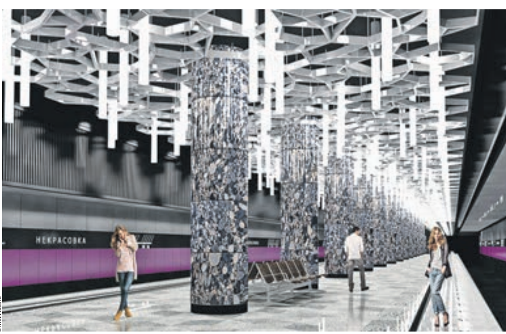
Проект строящейся станции Кожуховской линии метро «Некрасовка», которая будет располагаться в одноименном районе Юго-Восточного округа столицы