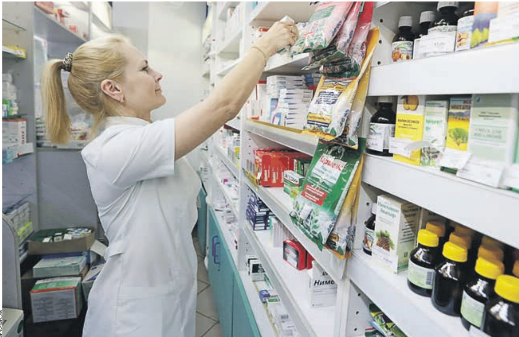
3 марта 2017 года 10:25 Одна из столичных аптек. Лекарства для льготников, как пояснили эксперты, также приобретаются в рамках государственных контрактов. Поэтому закупки медикаментов подлежат строгому контролю

Ксения Родионова, замначальника управления контро-