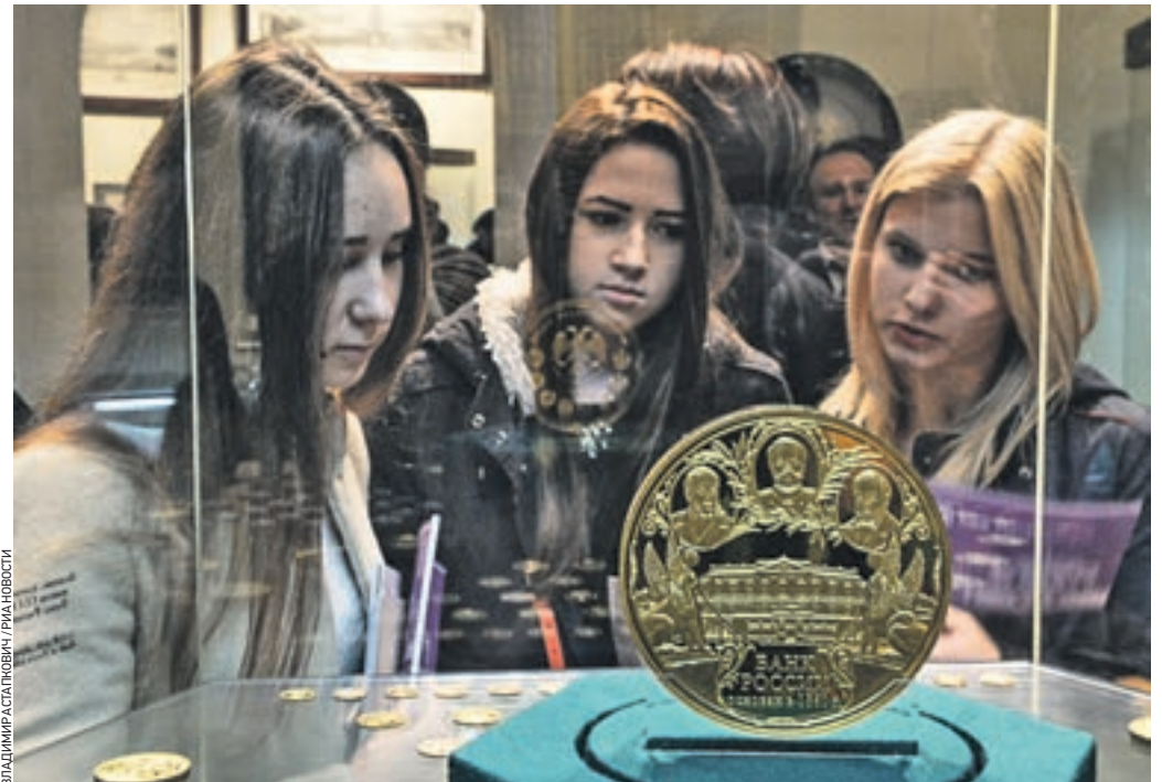
28 февраля 2017 года 13:50 Посетительницы Музея Центрального банка России рассматривают золотую юбилейную монету номиналом 50 тысяч рублей

Подобные монеты проще всего купить в банках. В любом большом офисе вам предложат целый набор. — Прежде всего ориентируйтесь на тираж. Чем он меньше, тем лучше, — рассказывает научный сотрудник Института востоковедения РАН, нумизмат Евгений Гончаров. Если средств у вас достаточно, лучше приобрести монету золотую. Потому что помимо нумизматической ценности она будет нести еще и ценность металла. Если средств не так много — покупайте монету серебряную. Эксперт также советует обратить внимание на зарубежные монеты. Но покупать их нужно в нумизматических лавках и на аукционах. И желательнее пользоваться подсказками экспертов. — Очень хороший вариант инвестиций — покупка дореволюционных монет из серебра и золота, — рассказывает Гончаров. — Ведь старые монеты представляют собой еще и немалую историческую ценность, которая ежегодно растет. Правда, учтите: монеты — это «долгие» вложения.