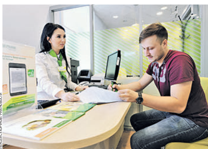
25 августа 2018 года. Менеджер банка общается с клиентом в одном из залов офиса по обслуживанию физических лиц