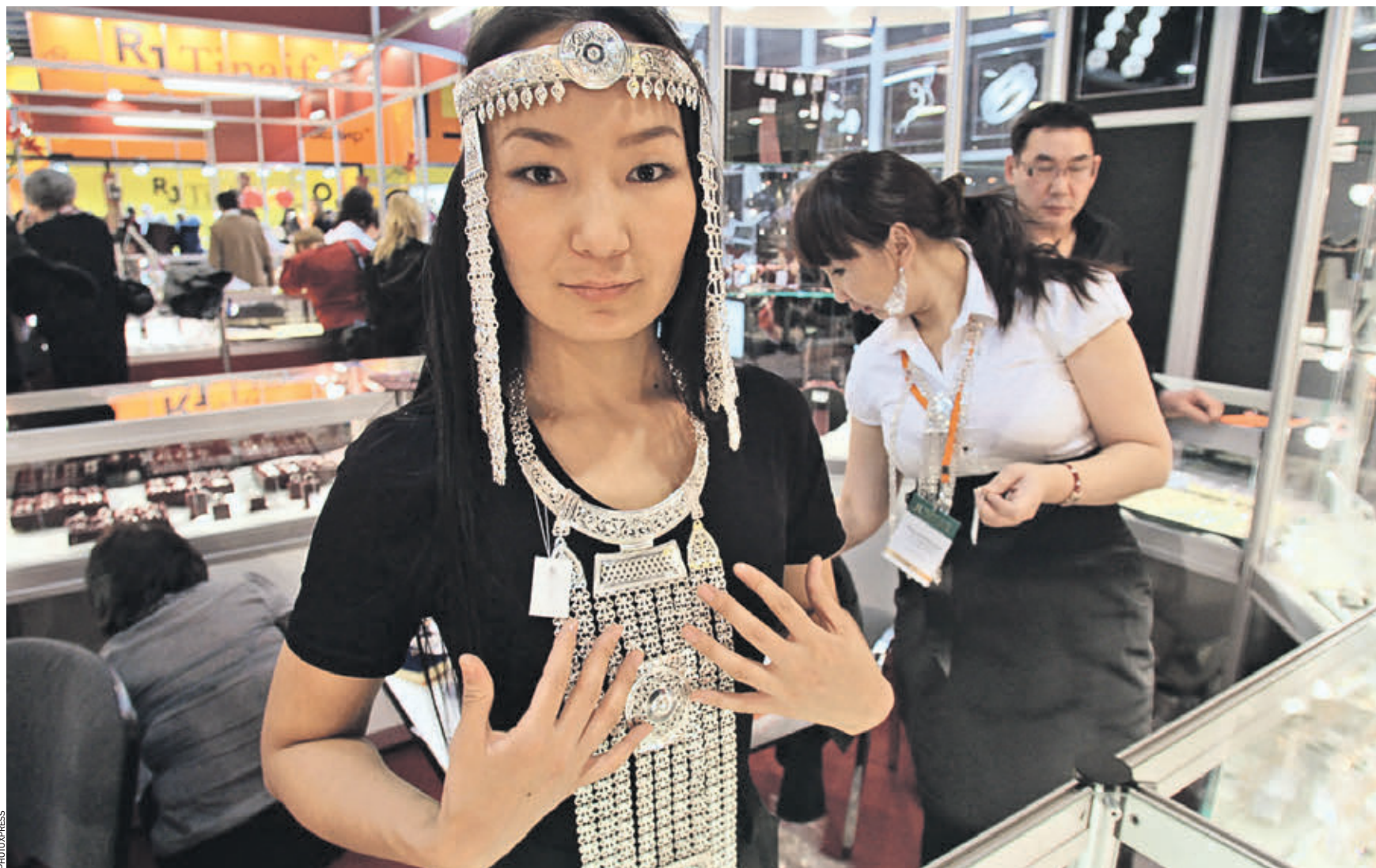
9 сентября 2018 года. Ювелирная выставка JUNWEX. Как поясняют социологи, жители северных регионов России, несмотря на более высокие зарплаты, все равно едут жить в Москву, поскольку не только уровень дохода определяет качество жизни

денеги Росстат развеял миф о москвичах как самых обеспеченных россиянах. Средняя зарплата жителей Чукотки и Ямало-Ненецкого округа оказалась существенно выше столичной.