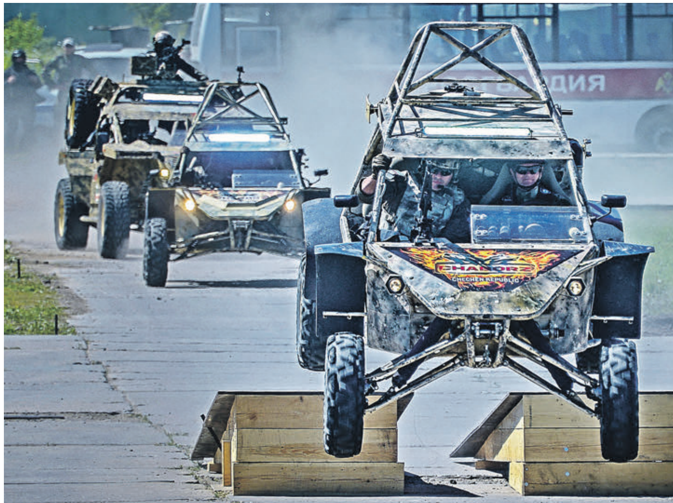
26 мая 13:04 Отряд багги «Чаборз» демонстрирует высокие ходовые характеристики. С полной нагрузкой они играючи преодолевают трамплин. Стихия этих машин — разведка, рейдовые действия и молниеносные налеты в тылу противника

На базе хорошо зарекомендовавшего себя трехосного грузовика «Урал» разработана машина «Федерал» для транспортировки личного состава