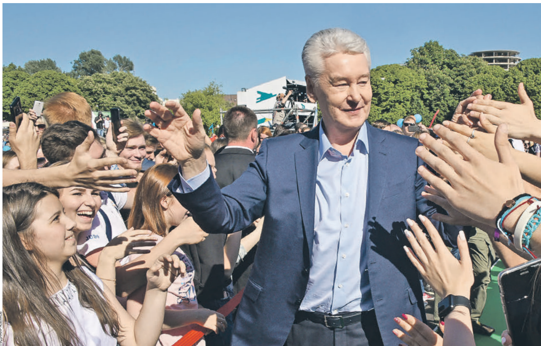
26 мая 2018 года 16:07 Сергей Собянин на праздновании четырехлетия проекта «Активный гражданин», на котором он сообщил о решении вновь выдвинуть свою кандидатуру на выборы мэра Москвы

выдвижение В субботу, 26 мая, мэр Москвы Сергей Собянин объявил о намерении баллотироваться на выборах главы столицы, которые пройдут в сентябре текущего года.