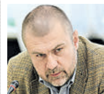
КИРИЛЛ КАБАНОВ ПРЕДСЕДАТЕЛЬ НАЦИОНАЛЬНОГО АНТИКОРРУПЦИОННОГО КОМИТЕТА

ют региональные ярмарки, налажены прямые поставки продукции из многих уголков страны, культурно-просветительские мероприятия. И подобных примеров в городе масса. Все это требует затрат, которые город на себя берет. Можно сказать, что Москва уже и так существенно материально поддерживает субъекты Федерации.