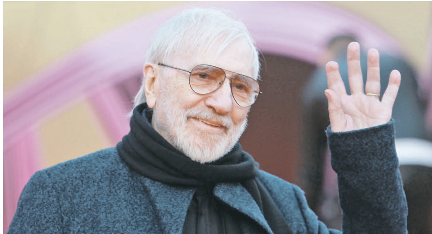
19 апреля 2018 года. Кинодраматург, режиссер Виктор Мережко на церемонии открытия 40-го Московского международного кинофестиваля

На встречу сценарист «Родни», «Здравствуй и прощай», «Вас ожидает гражданка Никанорова» и многих других фильмов, 80-летний драматург, режиссер, актер и народный артист России Виктор Мережко согласился сразу — когда узнал о теме встречи. В назначенное место, к Дому кино на Васильевской улице, Виктор Иванович, как истинный джентльмен, пришел без опоздания.