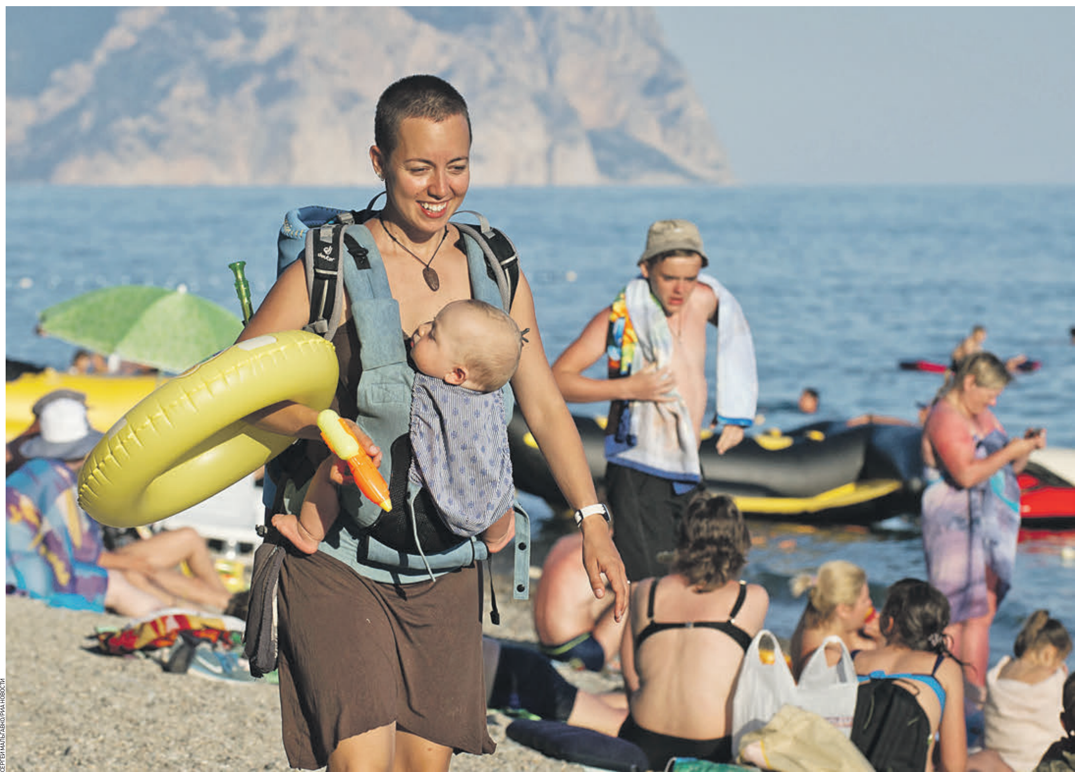
12 июля 2017 года. Мама с грудным ребенком на отдыхе в одном из южных регионов России. Некоторые родители — и таких немало — стремятся отвезти своих детей на морские пляжи под палящее солнце, не дожидаясь, пока чадо толком окрепнет. Забывая при этом, что на кону не только красивые фотографии в соцсетях, а иногда и жизнь малыша

это ракета украинской армии, и самолет, и так далее. Но повторяю, нет ничего, что внушало бы нам доверие в качестве окончательных выводов, и не будет такого без нашего полноценного участия в расследовании». Владимир Путин вновь обратил внимание на то, что Украина на лето 2014-го не выполнила обязательства по «закрытию» своего неба: «Почему-то о том факте, что Украина не выполнила своих обязательств, предусмотренных ИКАО, международной организацией по гражданской авиации, и не закрыла воздушное пространство над территорией, где шли боевые действия, даже никто не вспоминает». «Удручающие своей глупостью домыслы псевдорасследователей» — так назвали новые «доказательства» причастности России к крушению малайзийского самолета в Донецкой области в 2014 году в Министерстве обороны России. Военные вновь подтвердили, что ни один российский зенитно-ракетный комплекс никогда не пересекал границу с Украиной. Вся супостатская пропаганда сегодня работает по одному принципу — принципу highly likely. Хай-ли лайки — это, в переводе, «с высокой вероятностью» («скорее всего»). С высокой вероятностью в катастрофе самолета в небе другой страны виновата Россия. Скорее всего, предателя Скрипалю отравили российские спецслужбы. А еще — водонку у них, у русских, был Сталин, был Иван Грозный. Может, хватит метать бисер?