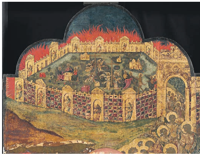
Фрагмент произведения конца XVII века «Воскресение — сошествие во ад»

В экспозицию вошли 57 предметов, созданных на основе голландского издания Священного Писания XVI века. Среди них есть не только иконы, сделанные русскими мастерами, вдохновленными Библией Пискатора, но и гравиюры, предметы декоративно-прикладного искусства из дерева, металла, кости и керамики.