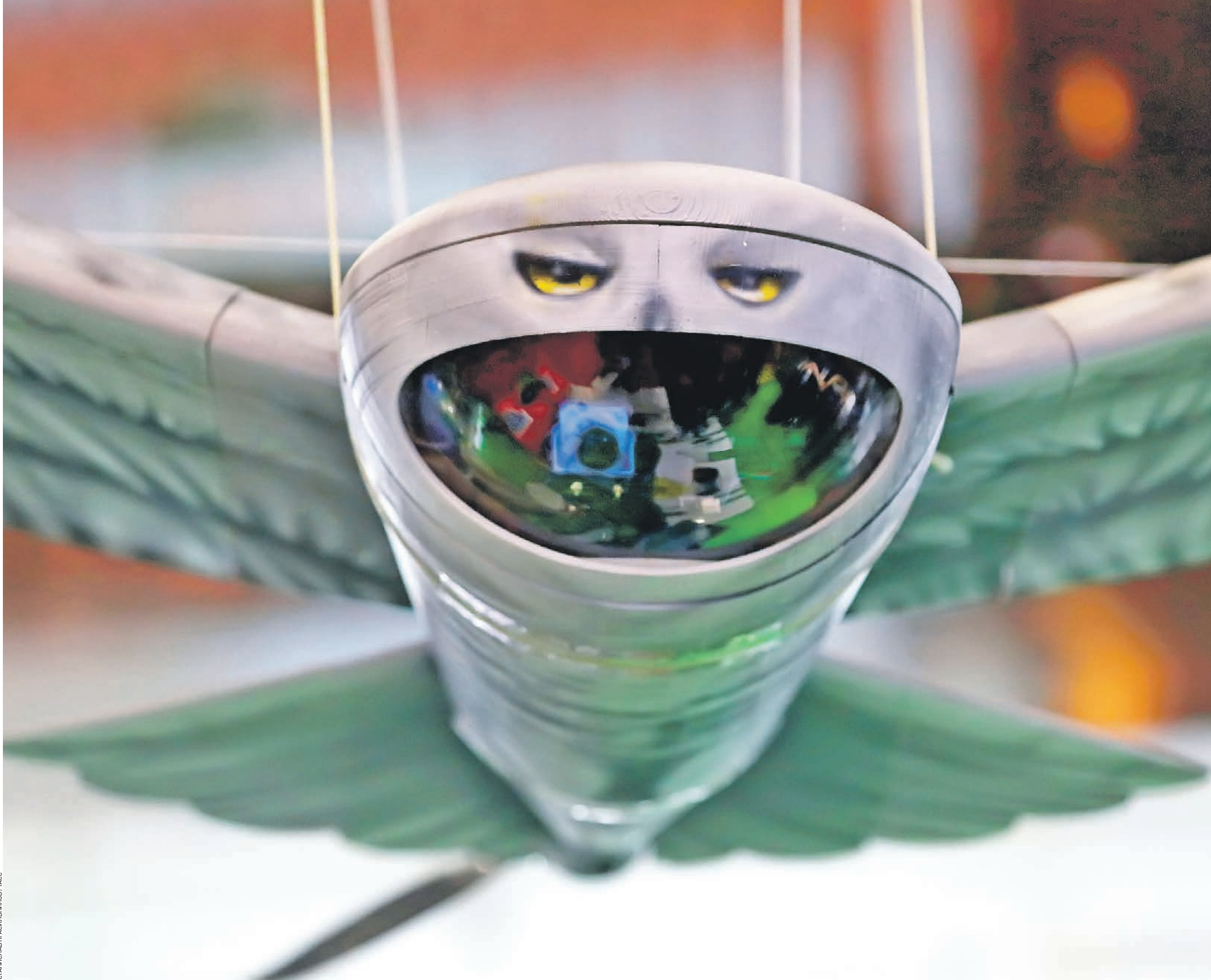
СТАНИСЛАВ КОСТИЧЕНКОВ / ТАСС