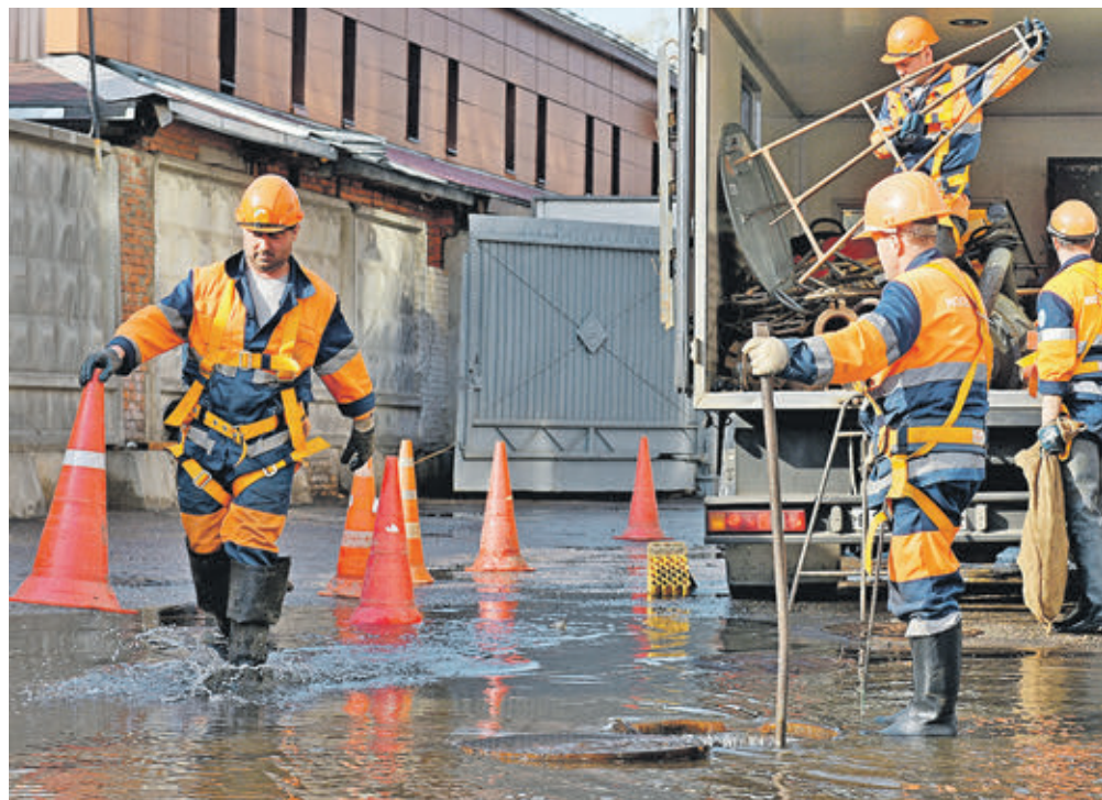
Вчера 17:00 Рабочие на территории промзоны бывшего завода «Серп и Молот» занимаются ликвидацией последствий затопления складских помещений