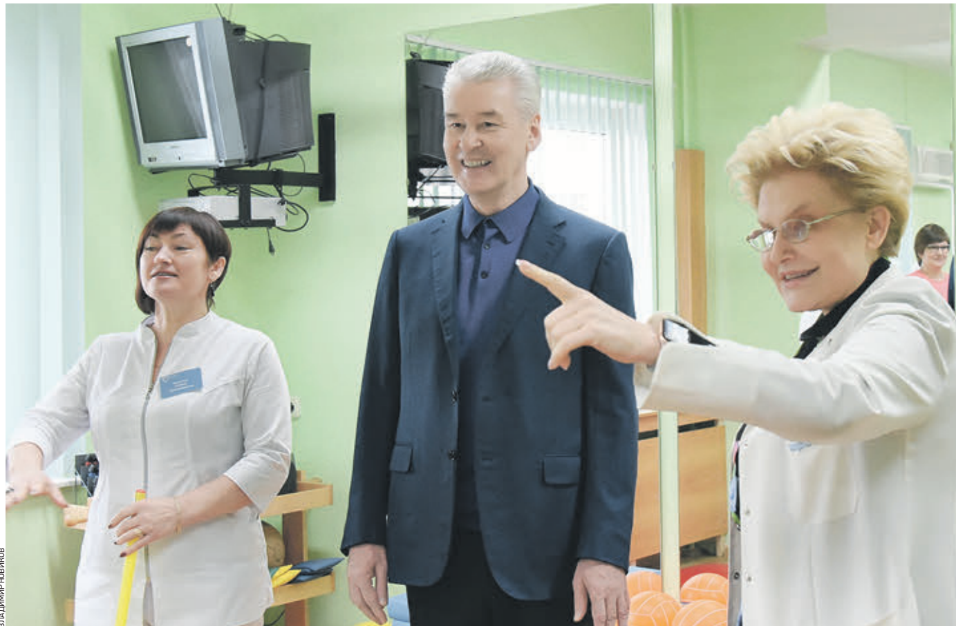
1 марта 2019 года 15:13 Мэр Москвы Сергей Собянин (в центре) во время посещения поликлиники № 180 со специалистом Еленей Зязяновой (слева) и телеведущей Еленой Малышевой (справа). Сейчас в столице стартует проект создания поликлиник нового поколения «Московский стандарт+», который улучшит качество обслуживания москвичей и инфраструктуру медучреждений

Мэр заявил: в этом году стартует проект создания поликлиник нового поколения «Московский стандарт+». Он будет включать несколько пунктов. Первый — это наличие кардиолога в каждом филиале.