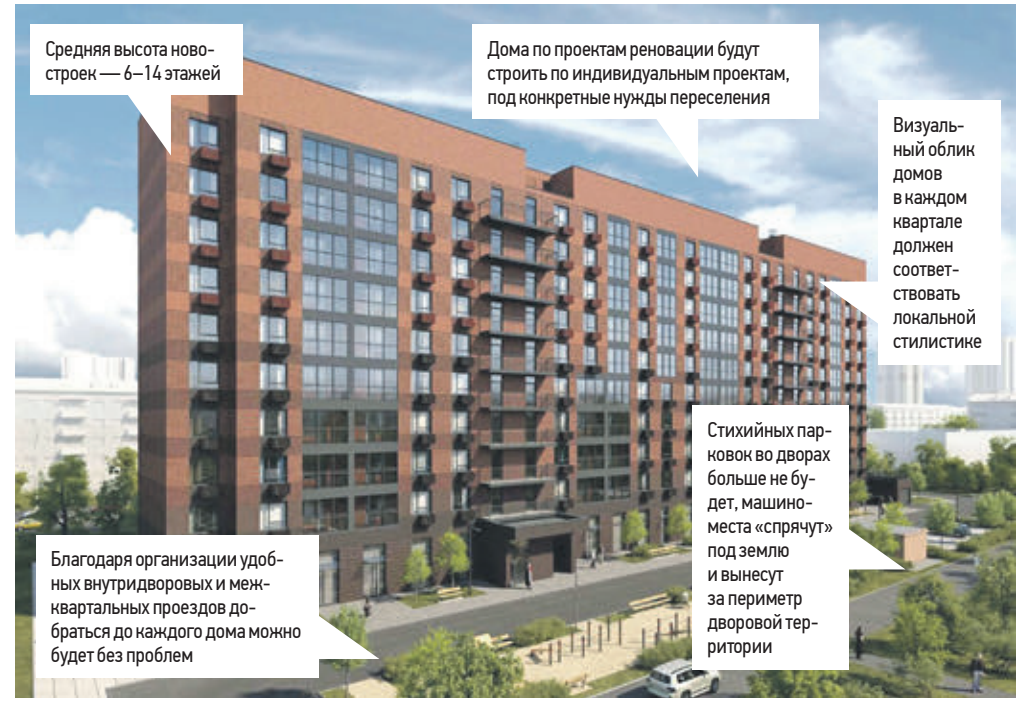
Средняя высота новостроек — 6–14 этажей

Во второй волне публичных слушаний по программе реновации жителям представили проекты планировки кварталов в районах Измайлово и Восточное Измайлово, Люблино, Свиблово, Бирюлево Восточное, а также в Бутырском районе. Пожелания, высказанные гражданами, будут учтены при доработке проектов.