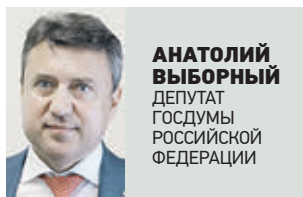
АНАТОЛИЙ ВЫБОРНЫЙ ДЕПУТАТ ГОСУД. ДУМЫ РОССИЙСКОЙ ФЕДЕРАЦИИ

Проработанный национальный стандарт также будет предъявлять определенные требования к ЧОПам. У них должна быть группа быстрого реагирования, кинологическая служба, в составе охранный организации должны работать и сотрудники высшей квалификации — 4-го, 5-го и 6-го разрядов. Будет проведена проверка на квалификацию и умение быстро и оперативно реагировать на различные ситуации. Специалистов обучат определенным техникам, чтобы они могли быстро и качественно определить по поведению человека его дальнейшие действия. Сегодня речь именно об этом. Для того чтобы выполнить требования законодательства, нормативно-правовых актов и должным образом обеспечить безопасность детей, нужно приложить немало усилий. Сегодня в сфере образования задействованы около 39 миллионов человек — это школьники, студенты, преподаватели. Поэтому должно быть определенное ответственное отношение к вопросу их безопасности. В ближайшее время национальный стандарт будет отмечен на сайте Ростстандарта. Эксперты смогут внести свои предложения, пожелания по проработке документа. В ближайшие несколько месяцев станут известны итоговые результаты по утверждению стандарта.