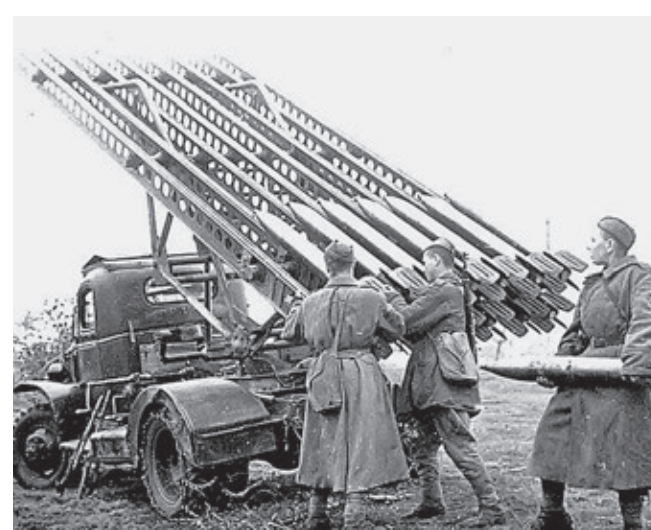
1945 год. Висло-Одерская операция. Расчет заряжает гвардейский реактивный миномет БМ-13 «Катюша»