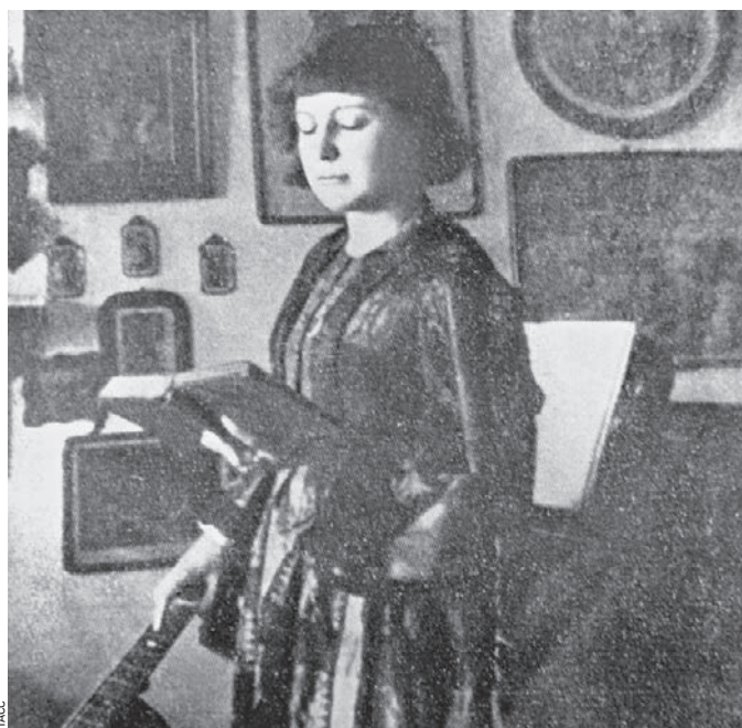
7 сентября 1914 года. Российская империя, поэтесса Марина Цветаева

В семье профессора Московского университета Ивана Владимировича Цветаева и пианистки Марии Мейн (ученицы Николая Рубинштейна) появилась на свет Марина — вторая дочь во второй семье будущего директора Румянцевского музея и основателя Музея изящных искусств. Мать видела девочку пианисткой, как она сама, но Марина явно тяготилась музыкой и предпочитала ей занятия язычной словесностью. Уже к шести годам она сочиняла стихи на русском, немецком, французском. Вообще юная Марина крайне серьезно относилась к своим занятиям, а в особенности к своим раздумиям. Так, после окончания домашнего обучения ее дважды определили в гимназию и дважды изгоняли с формулировкой: «за волюнтарство и несносный характер». Гимназию Марина окончила только к третьему разу. «Волюнтарство и несносный характер» Марины Ивановны проявятся еще не раз: так, будущее уже замужней дамой, Цветаева влюбилась в поэта Софию Парнок, их роман продлился без малого два года. В память об этих отношениях Цветаева написала сборник стихотворений с недвусмысленным названием «Подруга»... Первый сборник Марины Цветаевой увидел свет в октябре 1910 года, она полюбила его художнице Марии Башкирцевой, дневник которой в то время зачитывались многие литераторы. Марина Ивановна стремительно завязывала знакомства в тогдашних литературных кругах — Брюсов, Гумилев, Ахматова, конечно же, Максимилиан Волошин. В Коктебеле, на даче у Волошина, Цветаева