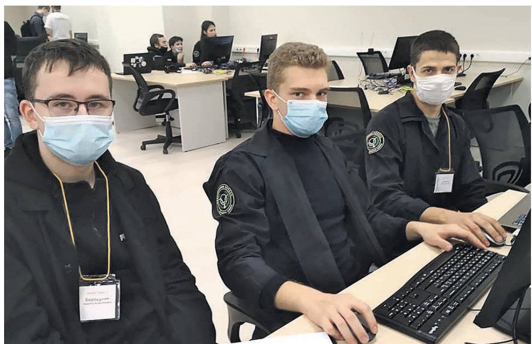
Вчера 13:35 Участники команды Kontur:team-C из Самарского исследовательского университета имени академика С. П. Королева во время первого дня соревнований «Радиофест-2020»

У родителей в МЭШ появилась возможность настроить уведомления: если раньше они приходили ежедневно в 18 часов, то сейчас можно настроить отправку на любое удобное время. Для этого нужно зайти раздел «Настройки». В назначенный момент мобильное устройство напомнит об уроках, домашнем задании и выставленных за день оценках. Быть в курсе школьных событий позволит новая функция просмотра чатов.