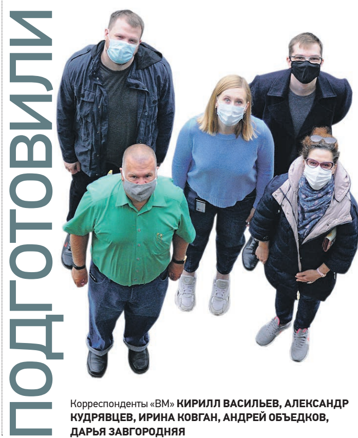
Корреспонденты «ВМ» КИРИЛЛ ВАСИЛЬЕВ, АЛЕКСАНДР КУДРЯВЦЕВ, ИРИНА КОВГАН, АНДРЕЙ ОБЪЕДКОВ, ДАРЬЯ ЗАВГОРОДНЯЯ

■ Верхняя нота Бежевые тренчи и безразмерные пальто — писк моды этой осени. Вещь велика вам на пару размеров? То что надо.