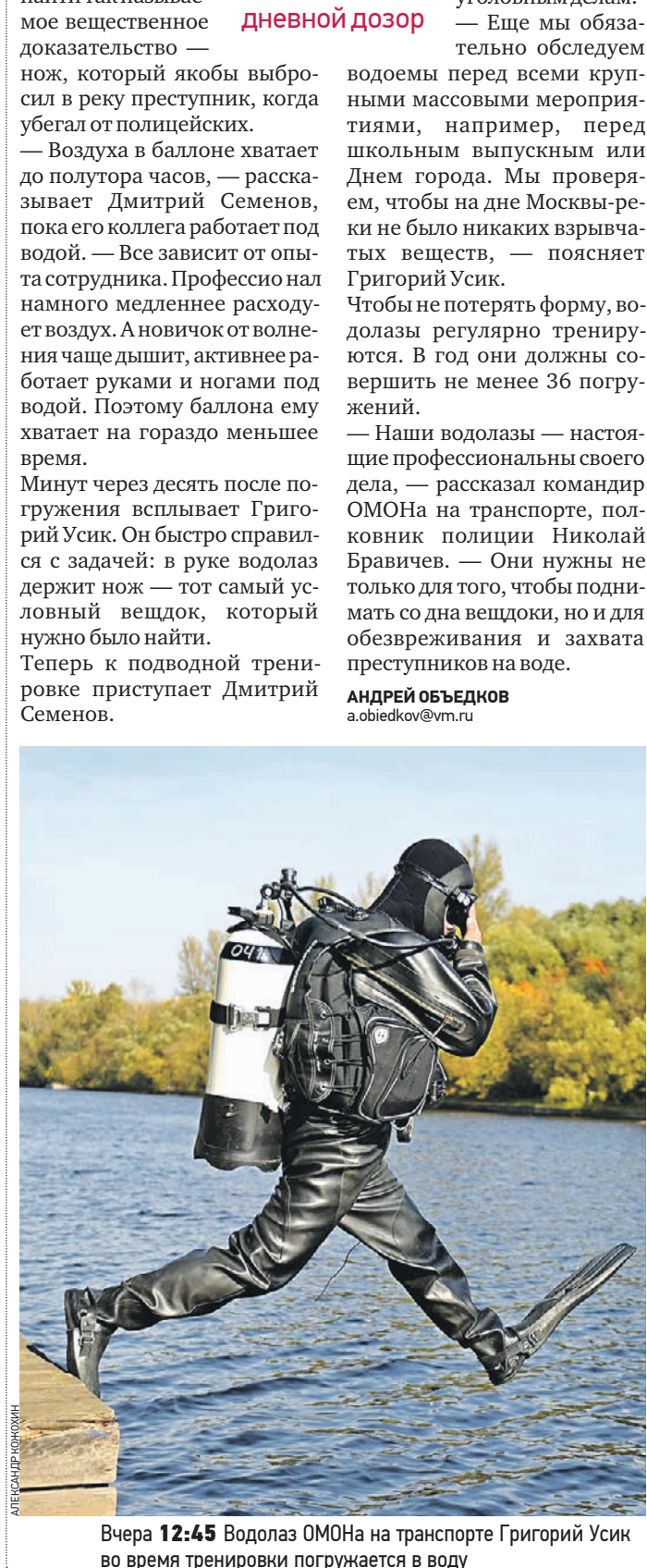
Вчера 12:45 Водолаз ОМОНа на транспорте Григорий Усик во время тренировки погружается в воду