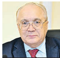
ВИКТОР САДОВНИЧИЙ РЕКТОР МГУ

Отдельно хотелось бы остановиться на других лекциях, которые ждут гостей нашего фестиваля. Всего будет проведено 300 таких мероприятий, причем пять лекций пройдут нобелевские лауреаты. Со многими из них мы традиционно сотрудничаем. Должен сказать как ученый: такая плеяда интереснейших лекций от профессионалов высочайшего класса — это настоящее счастье. Я приглашаю всех посмотреть их.