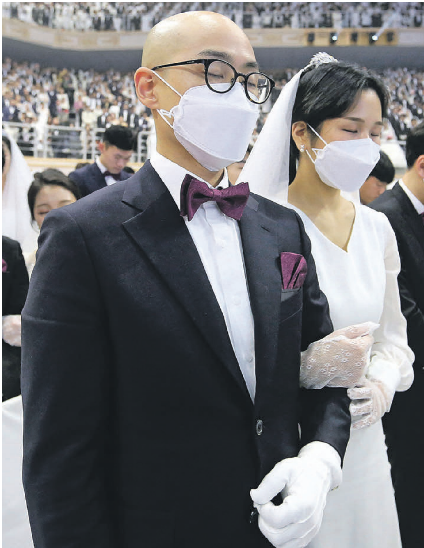
7 февраля 2020 года. Южная Корея. Церемония бракосочетания во Всемирном центре мира Чхонсим в Галенге. Чтобы свести к минимуму риск заражения коронавирусом и гриппом в общественном месте, пара надела медицинские маски