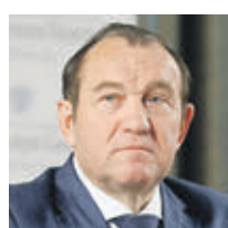
ПЕТР БИРЮКОВ ЗАМЕСТИТЕЛЬ МЭРА МОСКВЫ ПО ВОПРОСАМ НИЖИИ БЛАГОУСТРОЙСТВА