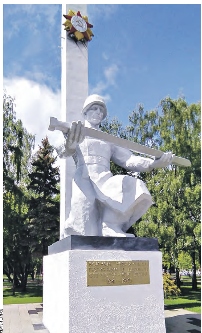
18 июня 2018 года. Памятник Героям-нефтяникам в Капотне. Его отремонтировали, а сквер вокруг привели в порядок