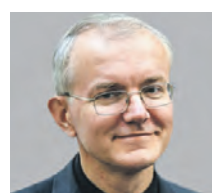
ОЛЕГ ШЕИН ДЕПУТАТ ГОСУДАРСТВЕННОЙ ДУМЫ РОССИИ

преследовать правительство России, вводя такой механизм? Очевидно, снижение темпов роста инфляции. Действительно, краткосрочный эффект от таких мер будет. Но он не продлится дольше трех или четырех месяцев. Зато мы увидим более долгоиграющие негативные последствия. Заморозка цен неминуемо приведет к нарушению конкуренции между производителями. Еще может разрушиться логистическая цепочка, а из-за этого вырастут цены на альтернативные товары.