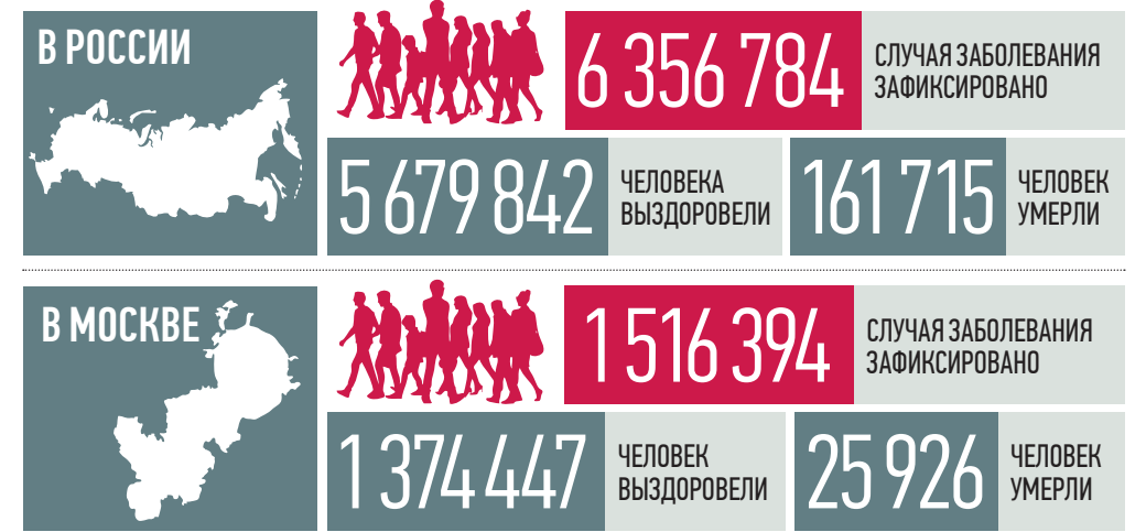
По данным стопкоронавирус.рф и mos.ru на 19:00 4 августа

Вакцинация населения от новой коронавирусной инфекции является одним из путей блокирования распространения мутаций вируса, сообщил вчера главный врач больницы в Коммунарке Денис Проценко. По его словам, мутация вируса является его естественной эволюцией.