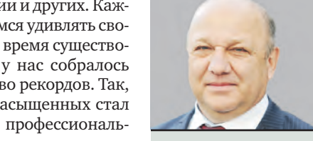
ВИТАЛИЙ СУЧОВ РУКОВОДИТЕЛЬ ДЕПАРТАМЕНТА НАЦИОНАЛЬНОЙ ПОЛИТИКИ И МЕНЬШИНОСТНЫХ СВЯЗЕЙ МОСКВЫ