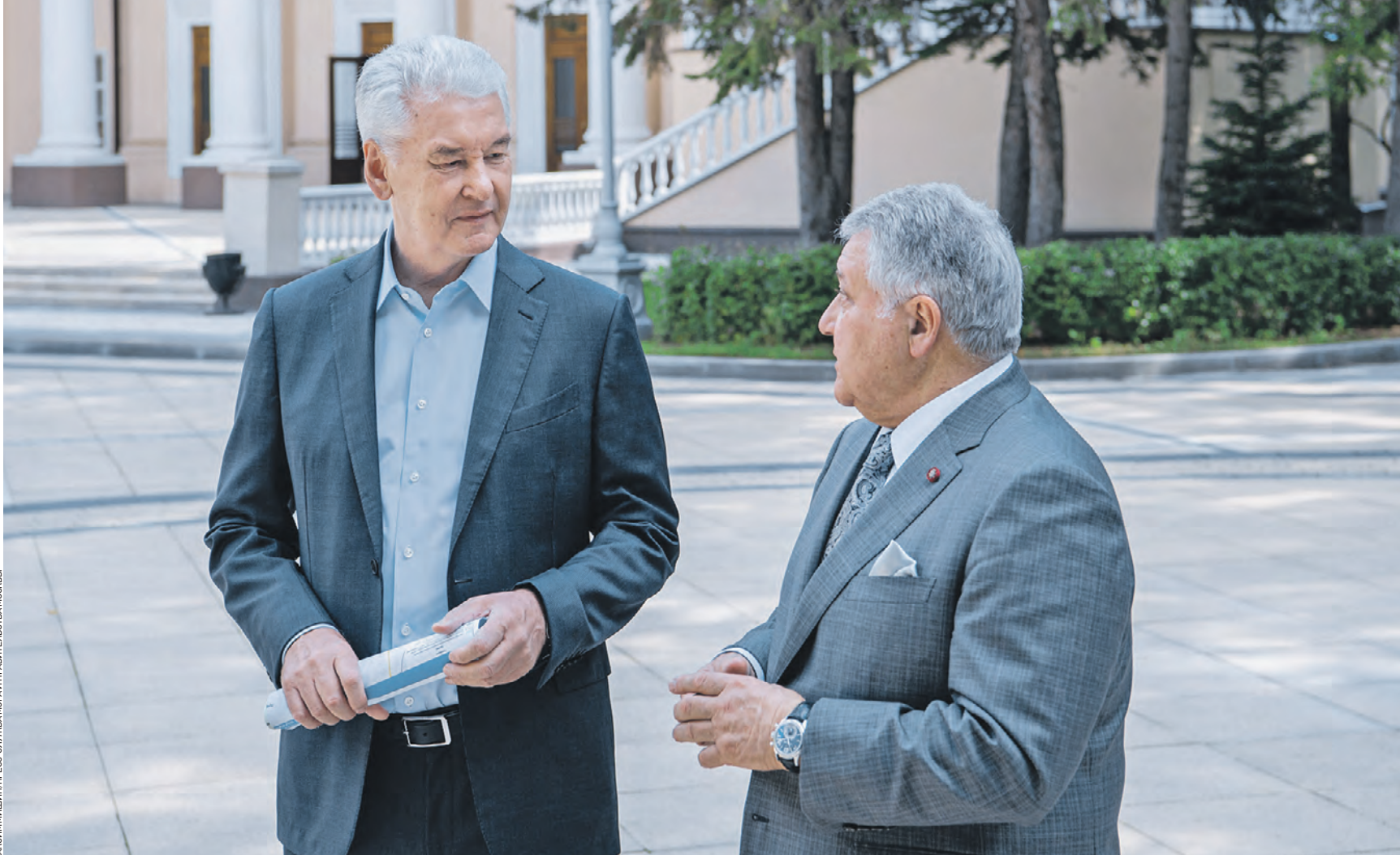
Вчера 12:23 Мэр Москвы Сергей Собянин (слева) и президент Национального исследовательского центра «Курчатowski институт» Михаил Ковальчук осматривали после реставрации Дом ученых имени академика Александра. Вокруг памятника архитектуре создано комфортное общественное пространство для всех жителей города

Дом ученых имени академика Александра построен в стиле советского монументального классицизма в 1949 году. Долгое время он работал как клуб, где отдыхали работники Курчатевского института. Здесь они обедали, читали в перерывах книги, вместе отмечали Новый год и другие праздники. В фойе клуба проходили художественные выставки, в актовом зале — собрания, ученые советы, конференции, а также встречи с актерами, режиссерами, поэтами и драматургами, киносеансы и концерты. — Здесь проходили встречи физиков и лириков, — отметил Сергей Собянин. — Ну а в 1990-е годы его постигла судьба многих — Дом ученых стал приходить в упадок. Несколько лет назад обветшавшее здание признали выявленным объектом культурного наследия столицы. Здание отреставрировали на средства Курчатевского института. Специалисты отремонтировали крышу, инженерные коммуникации, восстановили исторический фасад Дома ученых, планировку помещений и легендарный