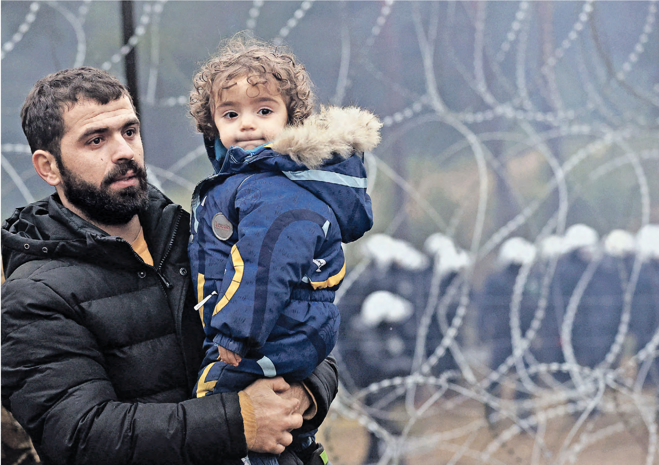
14 ноября 2021 года. Гродненская область. Лагерь мигрантов на польско-белорусской границе. Кризис на границе Белоруссии с Латвией, Литвой и Польшей, куда с начала года устремились мигранты, резко обострился 8 ноября

Что сейчас происходит на польско-белорусской границе и как будет развиваться ситуация