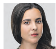
МАРИЯ ТЕРЕНТЬЕВА-ГАЛИЦКИХ ПРЕДСЕДАТЕЛЬ СОВЕТА НАЦИОНАЛЬНОЙ АССОЦИАЦИИ БЛОГЕРОВ

люди, зарабатывающие на рекламе в соцсетях, трудиться в таком формате? Не думаю, что желающих будет много.