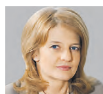
НАТАЛЬЯ КАСПЕРСКАЯ ПРЕЗИДЕНТ ГРУППЫ КОМПАНИЙ, СПЕЦИАЛИЗИРУЮЩИХСЯ НА ИНФОРМАЦИОННОЙ БЕЗОПАСНОСТИ

в Конституции России. Регистрация для входа в интернет создаст дополнительный черный рынок персональных данных. Например, появится новая услуга пробива: кто на какой ресурс заходил. Кроме того, нужно понимать, что даже если человек зарегистрировался и вошел в сеть, это вовсе не значит, что в данный момент компьютером, смартфоном или планшетом пользуется именно он. Так что, мне кажется, эта инициатива совершенно не решает проблемы безопасности. Сейчас любой массив данных, если он представляет для кого-то интерес, находится в зоне риска, и, как показывает практика, рано или поздно эти данные попадают в чужие руки.