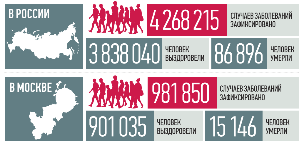
По данным стопкоронавирус.рф и mos.ru на 19:00 2 марта