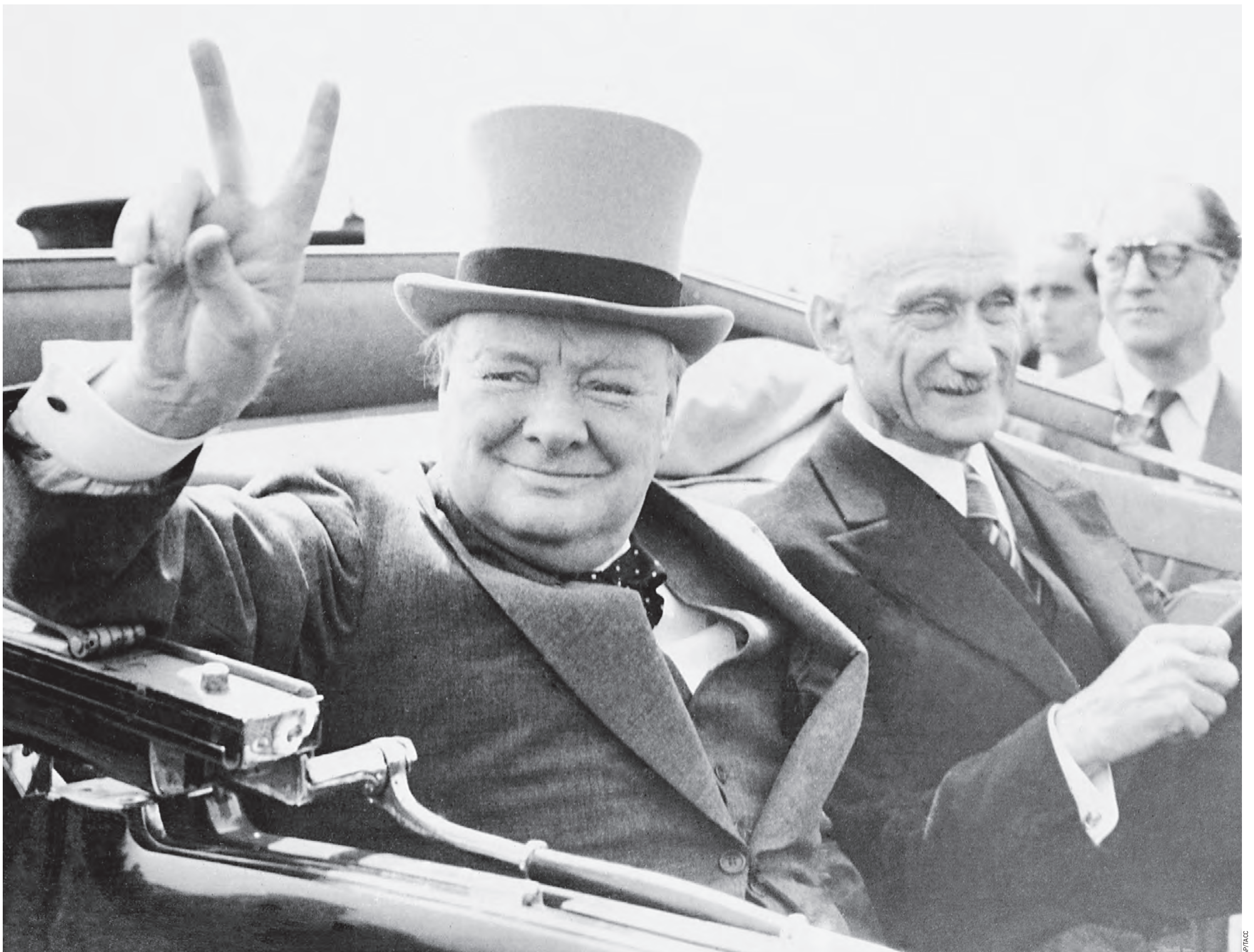
14 июля 1946 года. Премьер-министр Великобритании Уинстон Черчилль во время празднования Дня взятия Бастилии во французском городе Мец. Выражение «железный занавес» впервые произнес именно Черчилль 5 марта 1946 года в своей Фултонской речи. Оно обозначало информационный, политический и пограничный барьер, изолирующий СССР и другие социалистические страны от капиталистических стран Запада

Могут оставить послабления для студентов (хотя со стороны чехов и прибалтов звучат предложения «забанить» всех русских вообще), наверное, в меньшей степени для ученых и, видимо, совсем не оставят для журналистов. Усложнят бюрократию. Будут смотреть на место работы, на источники доходов. Требовать полной оплаты брони билетов и гостиниц. Могут появиться и мировоззренческие критерии. Не в такой грубой форме, как предлагают прибалты, чтобы спрашивать, «чей Крым» и об отношении к военным действиям на Украине. Но могут взять пример с американцев, где в визовых анкетах уже несколько лет требуют указывать аккаунты в соцсетях, чтобы посмотреть, кто там что пишет. А кто без аккаунта — тот, значит, едет в Солсбери глядеть на шпиль собора. Категории госслужащих и бизнесменов, которые имели преимущества по соглашению 2007 года, теперь заведомо «несимметризируют». Подсчитали, что потеря русских туристов обойдется ЕС в 21 млрд евро в год. Не стоит преувеличивать значение экономического фактора на фоне сильной политической мотивации. Тем