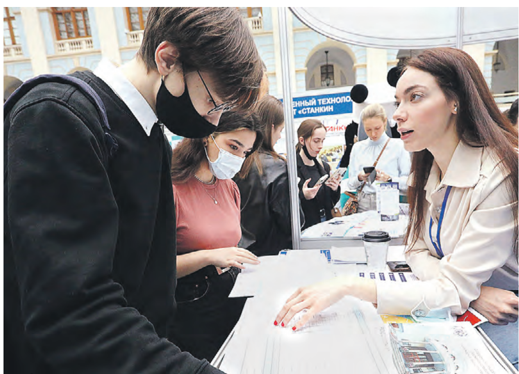
5 марта 17:05 Посетители выставки «Образование и карьера» в Гостином Дворе знакомятся с образовательными программами вуза

А «Наукоград» МФЮА провел занятие по цифровому моделированию зданий: здесь участники сделали несколько трехмерных моделей, разместили их на виртуальном участке земли и даже благоустроили его. Другой участник выставки — детский технопарк «Инжиниринг МГТУ имени Баумана» подготовил мастер-классы по изготовлению композитных изделий. В виртуальной лаборатории дети сами создавали новые материалы с помощью вакуумной инфузии. А на мастер-классе детского технопарка «Космгин парк» на базе РГУ имени Косыгина школьники познакомились с электронным конструктором: он не только помогает в обучении программированию, электро-