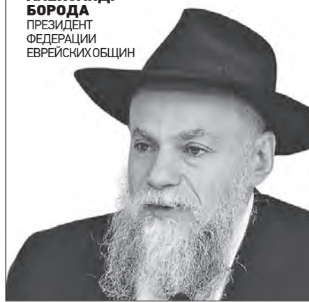
АЛЕКСАНДР БОРОДА ПРЕЗИДЕНТ ФЕДЕРАЦИИ ЕВРЕЙСКИХ ОБЩИН