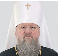
ИЛАРИОН митрополит донецкий и мариупольский

Великий пост — это особенное время. Время покаяния, молитвы, творения добрых дел. Задача святой Четыредесятницы — сотворить искреннюю молитву и принести плоды покаяния. Приблизиться к Богу, найти его и к нему прийти. Часто сделать это нам не удается. Враг рода человеческого всячески искушает нас. Каждый из нас, наверное, думает: я приду в храм, попрошу прощения у Бога, и Господь меня простит. Это хорошая, правильная мысль. Но для того, чтобы Он простил нам грех, мы должны принести плоды покаяния. К этому должны быть расположены наше сердце и помыслы. Мы особенно должны готовиться к этому таинству, искренне просить у Бога прощения своих прегрешений.