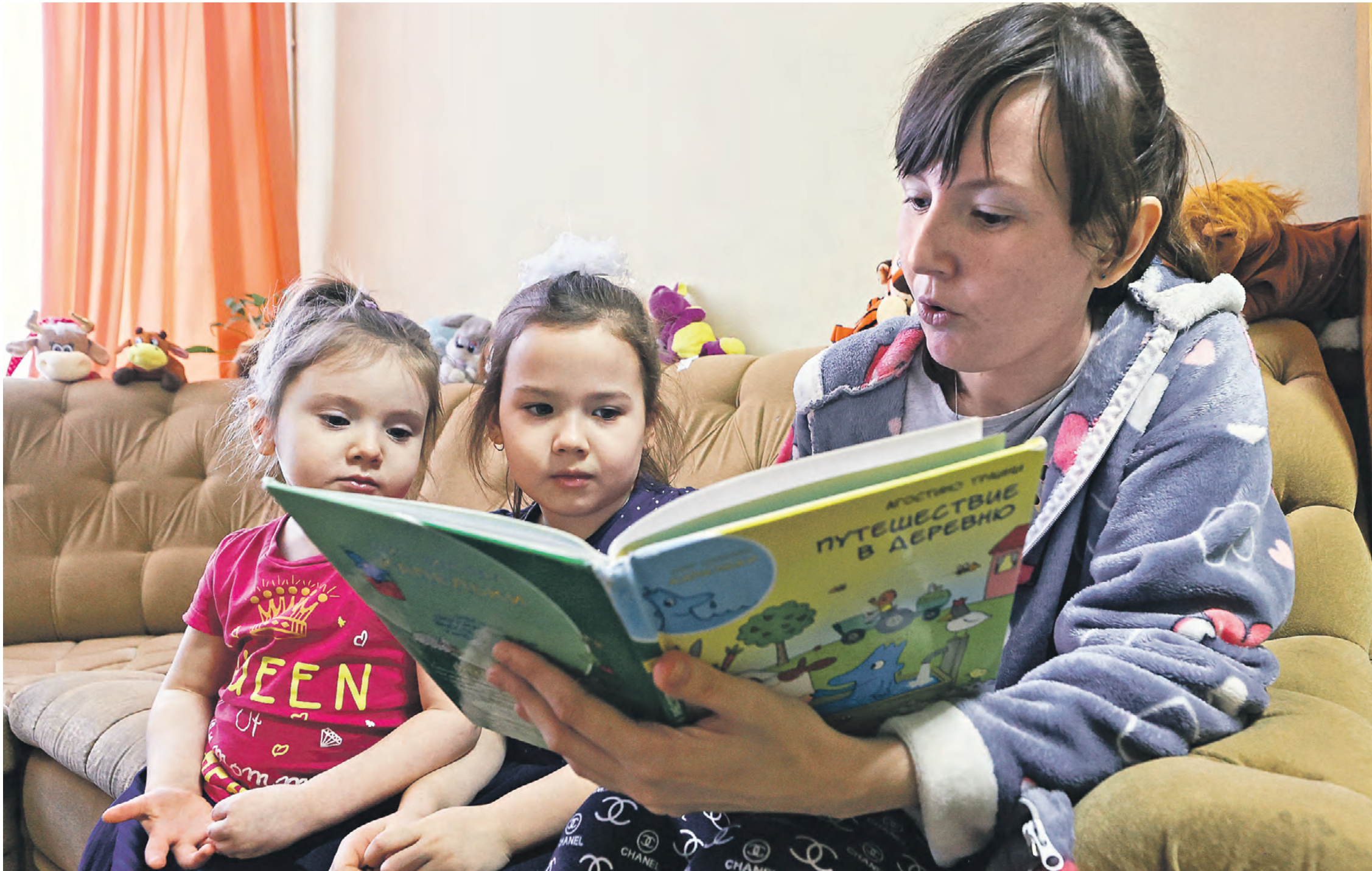
21 февраля 2023 года. Ленинградская область. Волхов. Женщина с детьми в пункте временного размещения, где проживают эвакуированные граждане из ДНР и ЛНР, Запорожской и Херсонской областей

Для перестройки экономики нужно сохранить нынешних граждан и привлечь новых