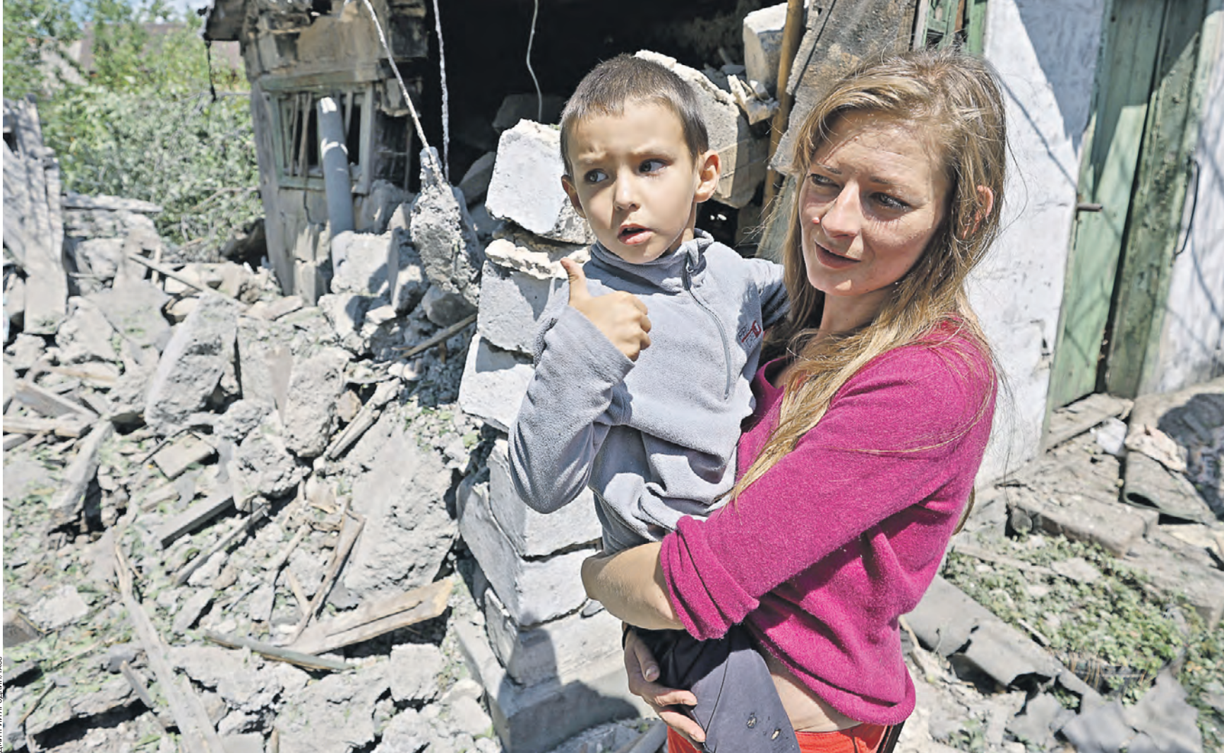
1 июля 13:19 Жительница Донецка с ребенком на руках рядом с разрушенным домом. Это последствие очередного обстрела Киевского района города со стороны формирований вооруженных сил Украины

По населенным пунктам Волоконовского района радикалы выпустили 24 снаряда. 23 из них припали на окраину хутора Старый, один — на отдаленный участок малогазоснащенного населенного пункта Киселев. — В Краснояружском районе с помощью дрона-камикадзе противник атаковал территорию села Поповка. Пострадавших и разрушений нет, — добавил губернатор Белгородской области. — Из артиллерии обстреляли село Вязовое — зафиксировано шесть прилетов. А по селам Новая Таволжанка и Терезовка Шебекинского городского округа неонацисты выпустили по шесть миномет-