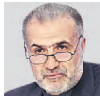
КАЗЕМ ДЖАЛАЛИ Чрезвычайный и Полномочный Посол Исламской Республики Иран в РФ

Старт мероприятиям дадут министр культуры Исламской Республики Иран Мохаммад Мехди Эсмаили и министр культуры Российской Федерации Ольга Любимова.