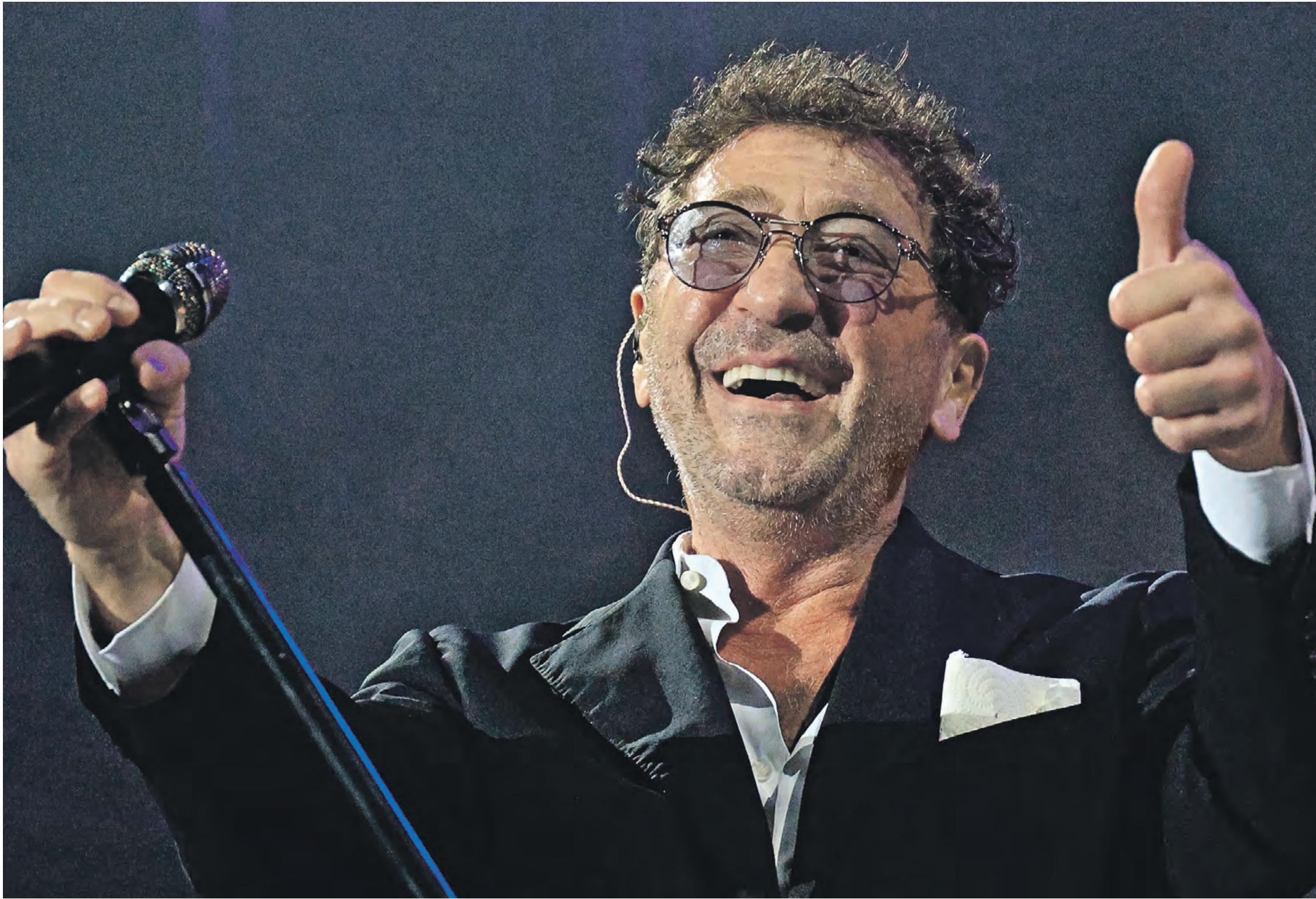
17 сентября 2022 года. Волгоград. Певец Григорий Лепс во время выступления на стадионе «Волгоград Арена». Григорий стал одним из немногих известных артистов, которые поддерживают СВО

Кто заменит уехавших на Запад звезд, оказавшихся предателями Родины