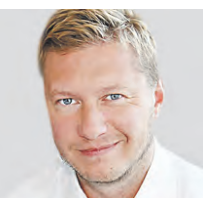
КИРИЛЛ МАСЛИЕВ ПРЕДСЕДТЕЛЬ КОМИТЕТА ПО СПОРТУ И ТУРИЗМУ МТПП