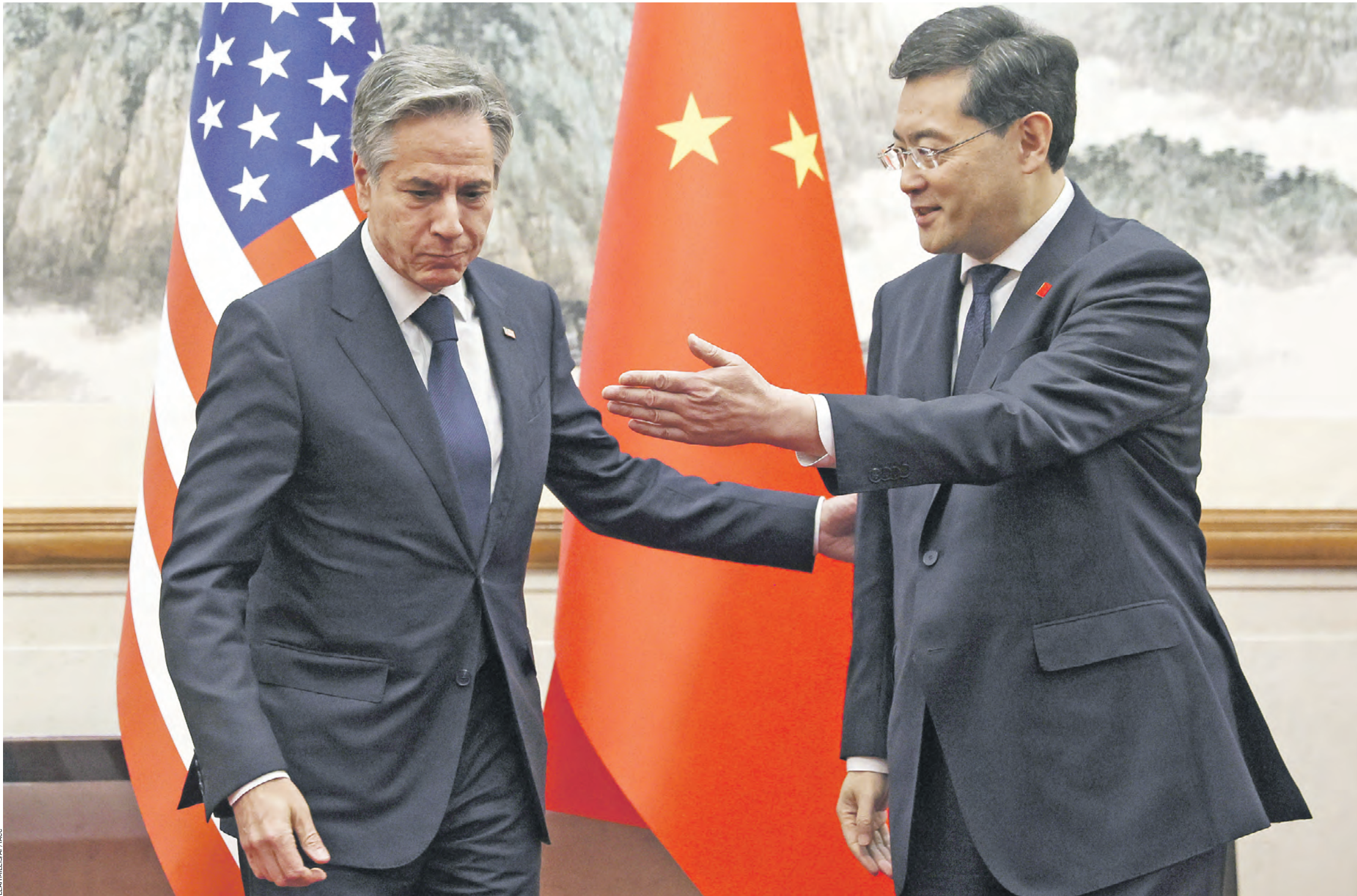
16 июня 2023 года. Китай. Пекин. Госсекретарь США Энтони Блинкен (слева) и министр иностранных дел Китая Цинь Ган во время официальной встречи, которая демонстрирует желание США и Китая достигнуть стабильности

Китай — США: не друзья и не враги. Скорее компаньоны и конкуренты одновременно