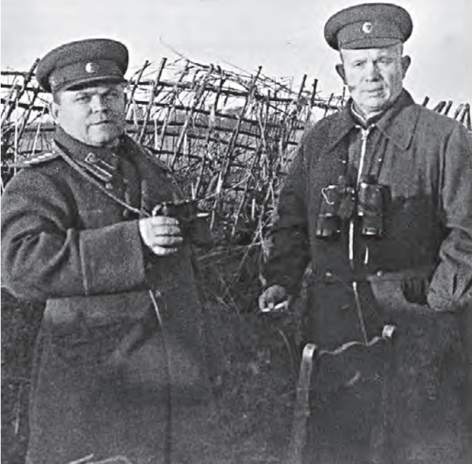
5 июля 1943 года. Командующий Воронежским фронтом Николай Ватутин (слева) и член Военного совета фронта Никита Хрущев на Курской дуге

Сегодня — День воинской славы России. 80 лет назад началось крупнейшее танковое сражение на Курской дуге в районе Прохоровки. Главной силой контрuderа стала 5-я гвардейская танковая армия под командованием Павла Ротмистрова. Официальная советская версия событий, которые разворачивались в этот день на полях белгородчины, гласит, что было напряженное встречное танковое сражение, в результате которого второй танковый корпус практически перестал существовать, как военная сила.