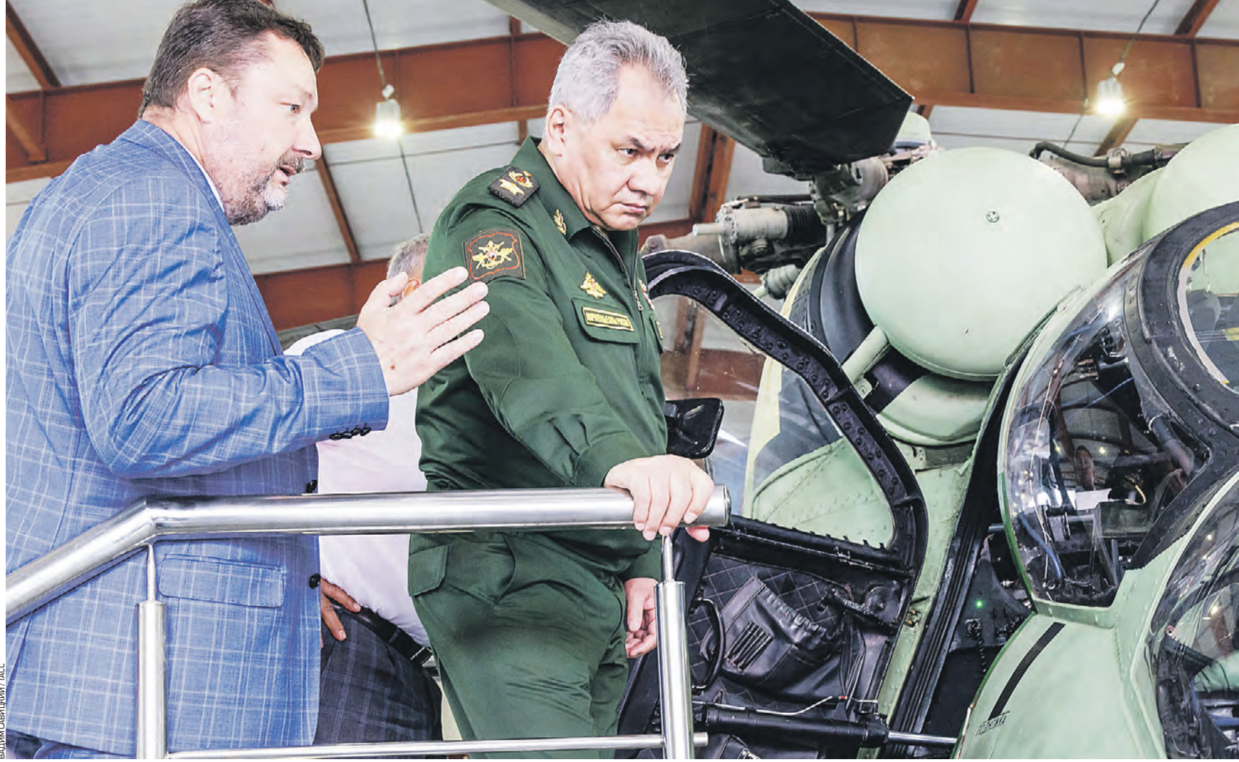
Вчера 15:01 Министр обороны РФ Сергей Шойгу (в центре) во время инспектирования Казанского авиационного завода имени С. П. Горбунова, который осуществляет производство стратегических ракетносцев Ту-160, их ремонт, а также модернизацию дальних бомбардировщиков Ту-22М3

А бойцы легендарной 4-й бригады второго армейского корпуса ДНР и спецназа «Ахмат» на Бахмутском направлении взяли в плен несколько украинских военнослужащих. — Все это произошло на фоне массовой истерии украинских СМИ о том, что данный населенный пункт находится под