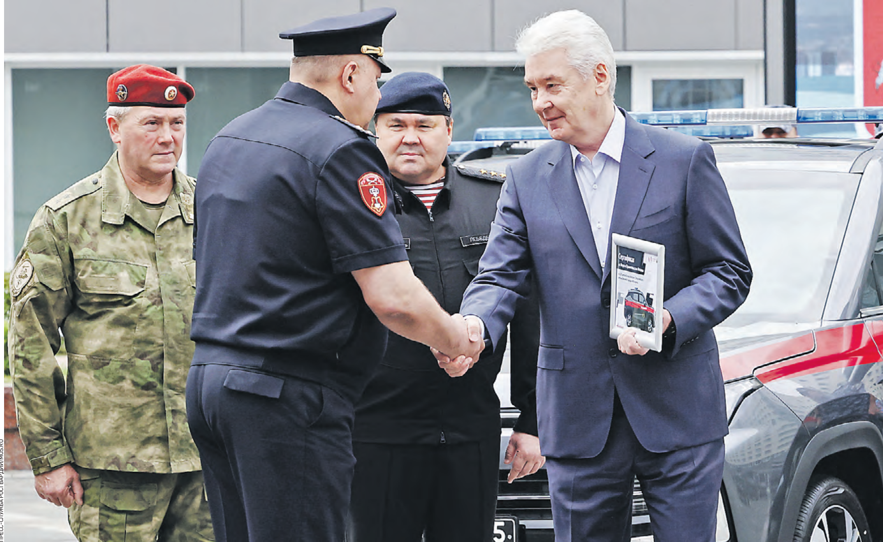
Вчера 13:07 Мэр Москвы Сергей Собянин (справа) передает начальнику Управления вневедомственной охраны войск национальной гвардии Российской Федерации по городу Москве Игорю Ерошенко автомобили «Москвич 3» для обеспечения деятельности сотрудников ведомства

На страже безопасности Машины ведомству лично вручил Сергей Собянин, который вместе с директором Федеральной службы войск национальной гвардии Российской Федерации Виктором Золотовым посетили базу Росгвардии — городок ОМОН в Строгине на улице Твардовского, 2.