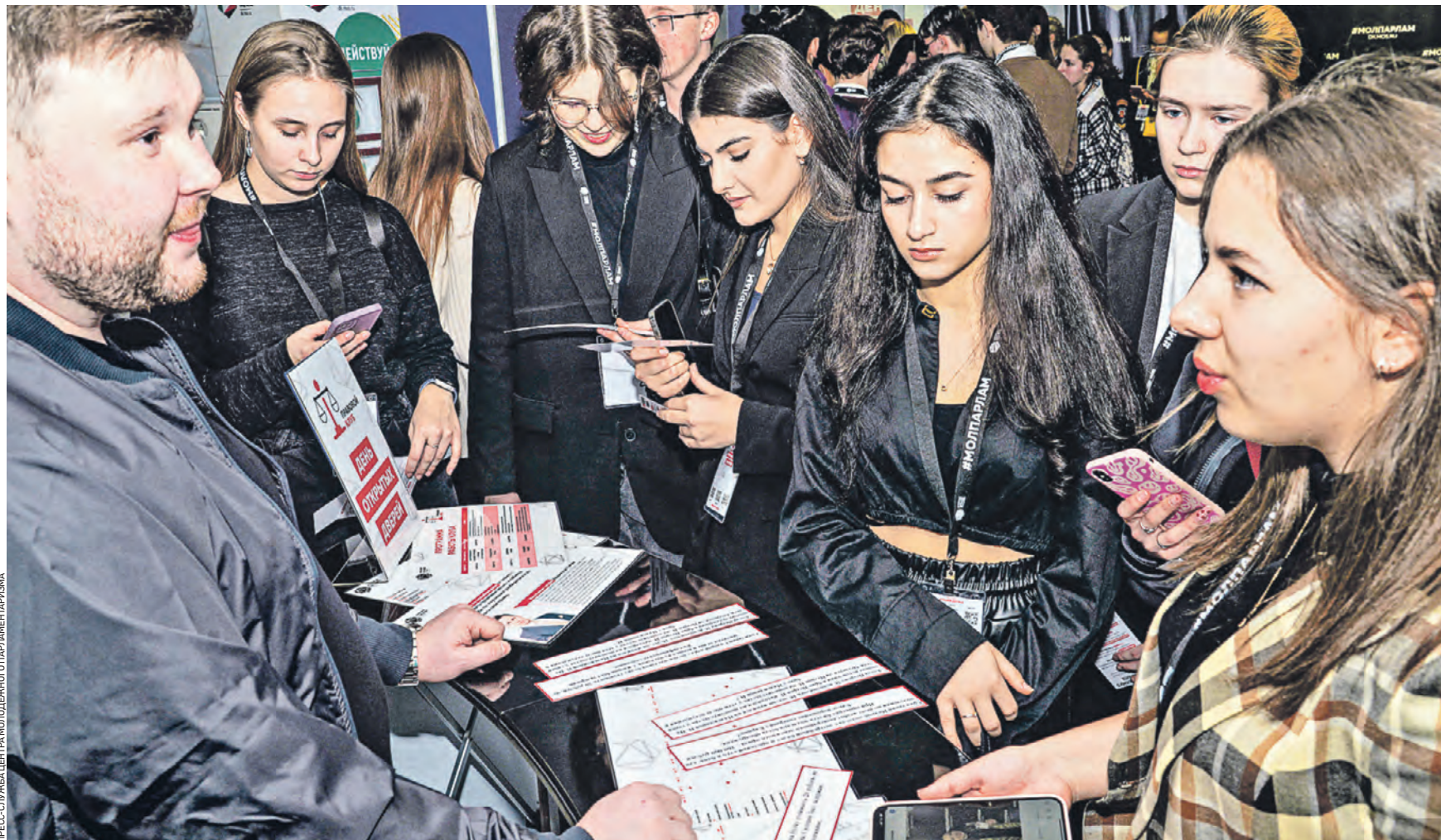
26 января 2023 года. В Центр молодежного парламентаризма на День открытых дверей пришла активная московская молодежь. Многие из них теперь волеются в самую крупную молодежную организацию города