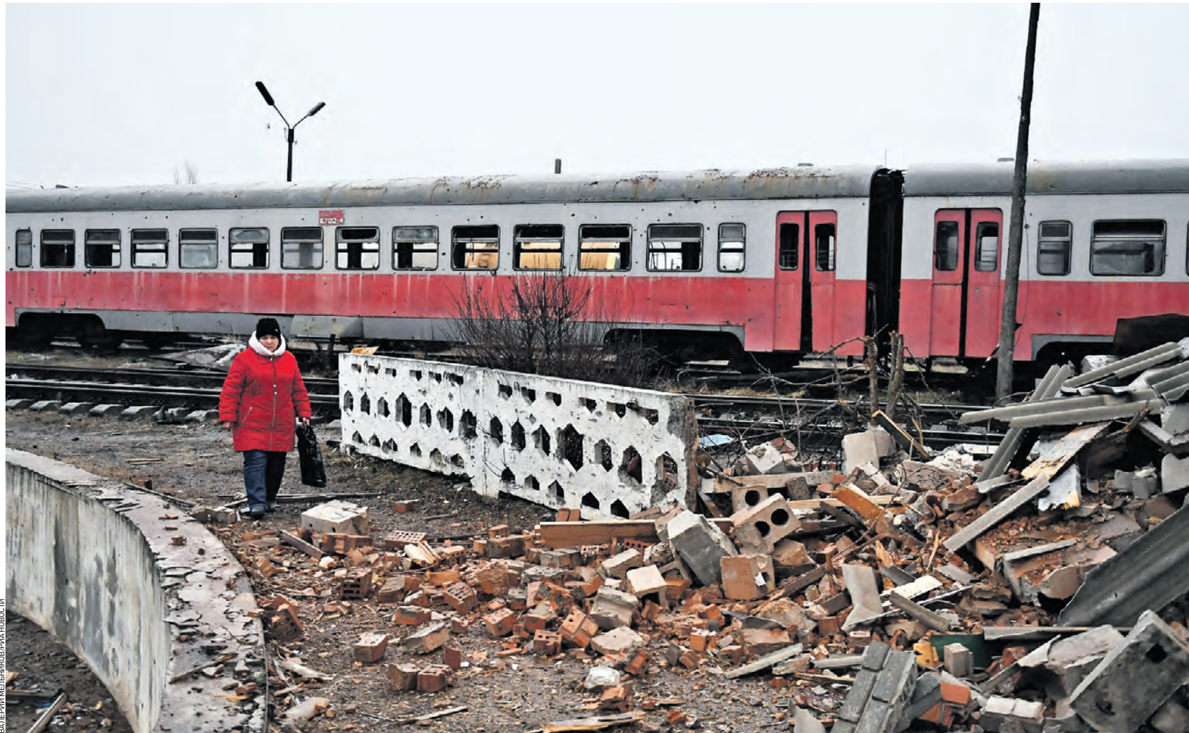
Вчера 08:53 Последствия ракетного удара вооруженных сил Украины по городу Иловыйску Донецкой Народной Республики. Из-за многочисленных обстрелов там пострадала инфраструктура железнодорожной станции

— Больше пяти снарядов попали в детское отделение и отделение женской консультации. Также разбит рентген-кабинет. Погибших и пострадавших нет, — сообщили в администрации Новой Каховки. Там же добавили, что в результате этого бесцеловечного поступка украинских националистов повреждена подстанция, находящаяся на территории больницы города в микрорайоне «Сокол». Кроме того, ВСУ с начала года трижды наносили удары по больницам Луганской Народной Республики. Об этом сообщил бывший глава ЛНР в России Родион Мирошник.