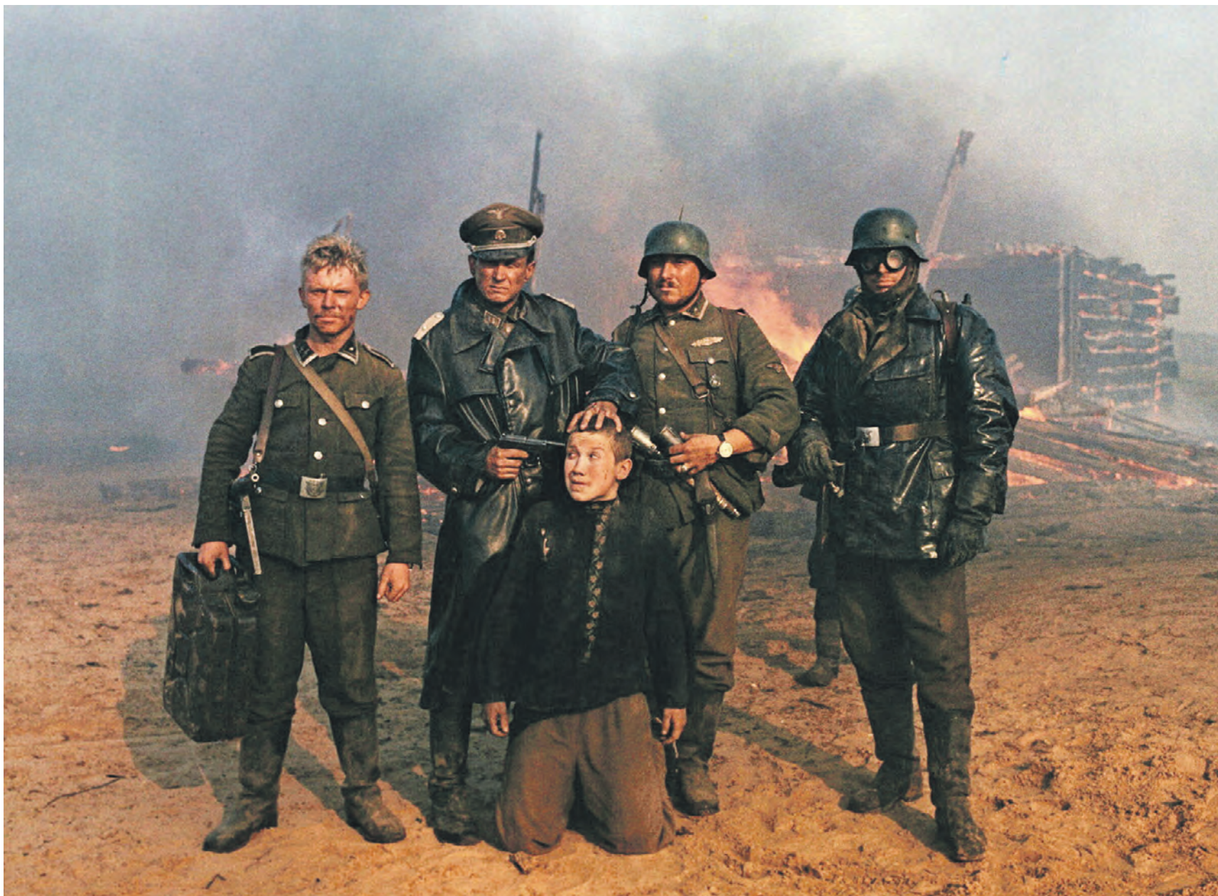
Кадр из фильма «Иди и смотри». В 2018 году этот фильм вошел в сотню лучших неанглоязычных фильмов по версии британской телерадиокорпорации BBC, одного из основных пропагандистских каналов западного мира. Рейтинг составили кинокритики из 43 стран. Спустя короткое время «западные партнеры» пытаются заставить нас забыть то, что пережил советский народ во время Великой Отечественной войны, устранив войны памяти

сии признают Великую Отечественную войну важнейшим событием нашей истории, а День Победы — главным праздником страны.