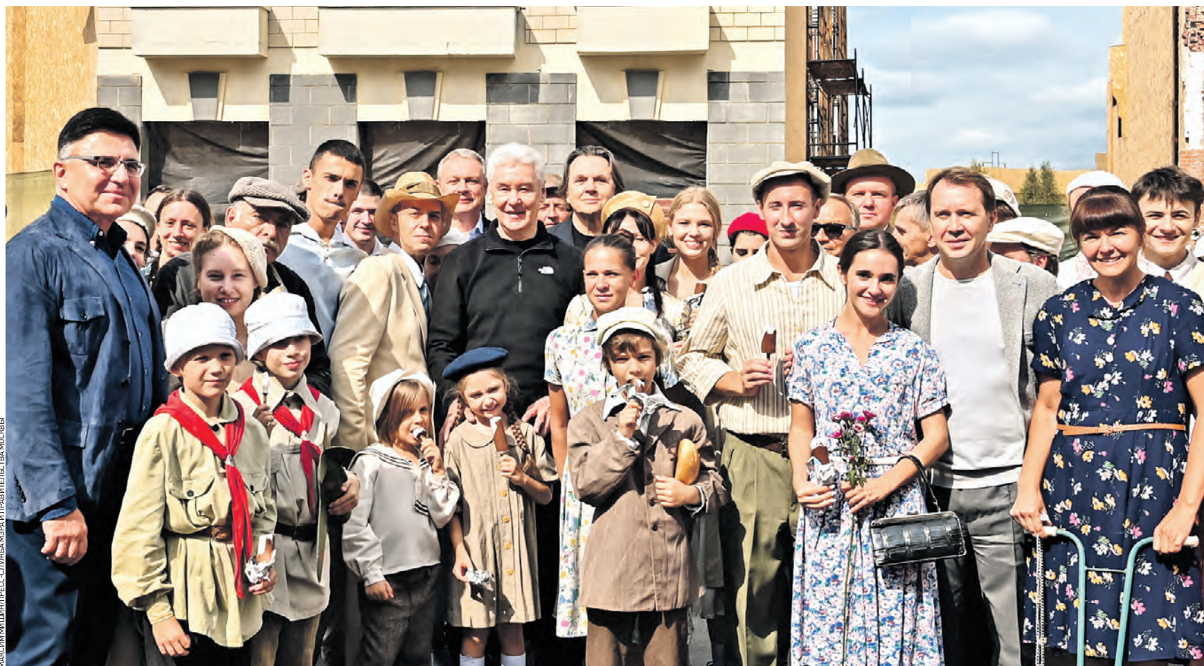
Вчера 11:53 Мэр Москвы Сергей Собянин (в центре), гендиректор «Газпром-медиа холдинга» Александр Жаров (крайний слева), художественный руководитель продюсерского центра «Студия Третий Рим» Евгений Миронов (второй справа), актер, режиссер и продюсер Сергей Жигунин, гендиректор Первого канала Константин Эрнст (слева направо на втором плане) и актеры исторического сериала в декорациях Москвы 1940-х годов