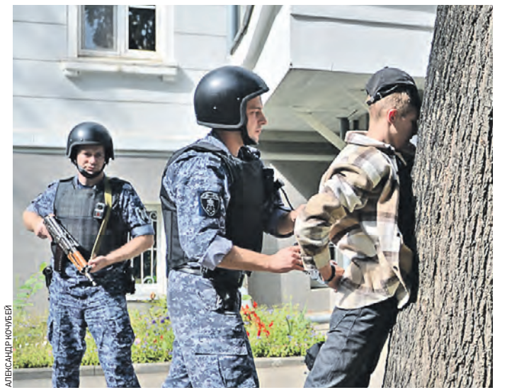
Вчера 12:23 Сотрудники Росгвардии задерживают условного нарушителя во время проверки безопасности в Доме детского творчества «На Таганке»

Вчера представители вневедомственной охраны и центра лицензионно-разрешительной работы Росгвардии проверили безопасность и работоспособность технических средств охраны в Доме детского творчества «На Таганке».