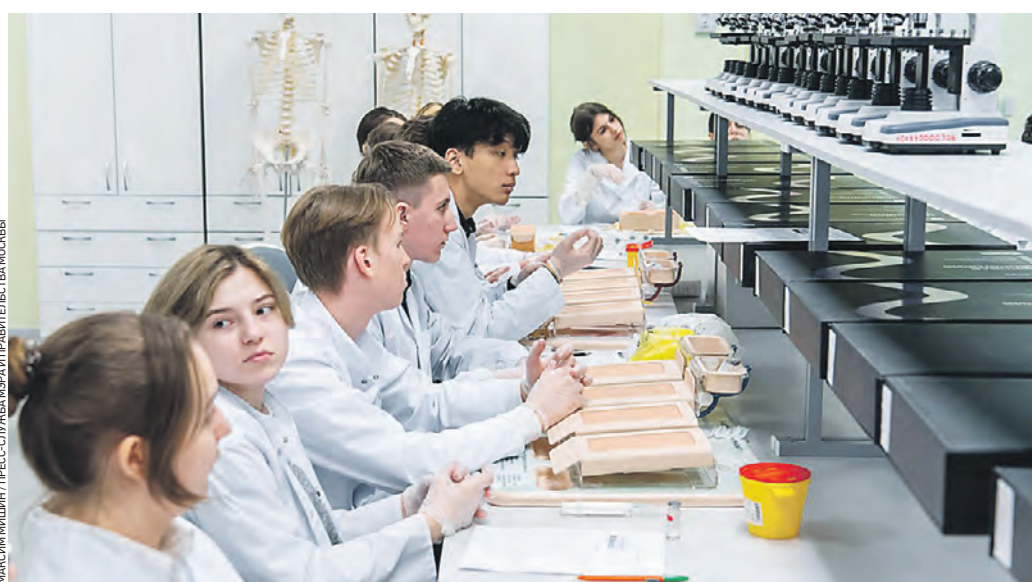
Для учащихся школ будут доступны кабинеты с зонами для проведения различных экспериментов. Дети смогут изучать биологию, астрономию и другие предметы

В рамках экспертизы проектной документации и результатов инженерных изысканий проверяется соответствие проектов действующим строительным и санитарным нормам, правилам и требованиям по безопасности, надежности и качеству, а также учитывается оптимальность предложенных сметных решений. Так, сначала года эксперты Мосгосэкспертизы выдали 30 положительных заключений по проектам строительства в столице новых школ и детских садов. Это — учебные заведения, строящиеся как за счет средств городского бюджета, так и за счет инвесторов. Сегодня в образовательных учреждениях города создаются все необходимые условия для комфортного обучения и всестороннего развития де-