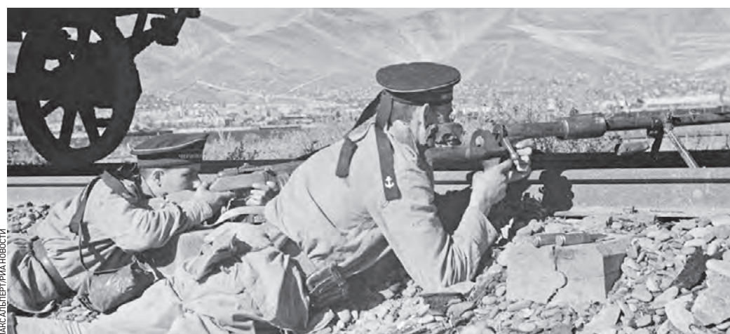
15 сентября 1943 года. Бойцы морской пехоты Черноморского флота ведут бой на железнодорожной насыпи в районе новороссийского рывозавода

В этот день 80 лет назад начался десантная операция в районе Новороссийска, в результате которой образовался легендарный плацдарм «Малая земля».