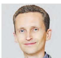
АЛЕКСЕЙ ГОРЬЕВ ПРОФЕССОР ФИНАНСОВ РОССИЙСКОЙ ЭКОНОМИЧЕСКОЙ ШКОЛЫ

Я уверен, что наличные деньги никуда не уйдут. Тем более что сейчас 15 триллионов рублей на зарплату у нас выдают в конвертах. Так что наличка все равно останется с нами. Более того, у нас есть консервативные люди, которые опасаются хранить деньги на карточке. Мы не скандинавские страны, где доля налички почти равна нулю. Более того, когда был ковид, а потом начался СВО, доля налички резко увеличилась. А еще надо учитывать, что ставки по вкладам хоть и выше инфляции, но не такие большие. Поэтому многие предпочитают держать деньги дома, «под матрасом». Это факт. И ничего плохого я в этом не вижу. Я пользуюсь картой, но определенная сумма наличности у меня всегда есть дома.