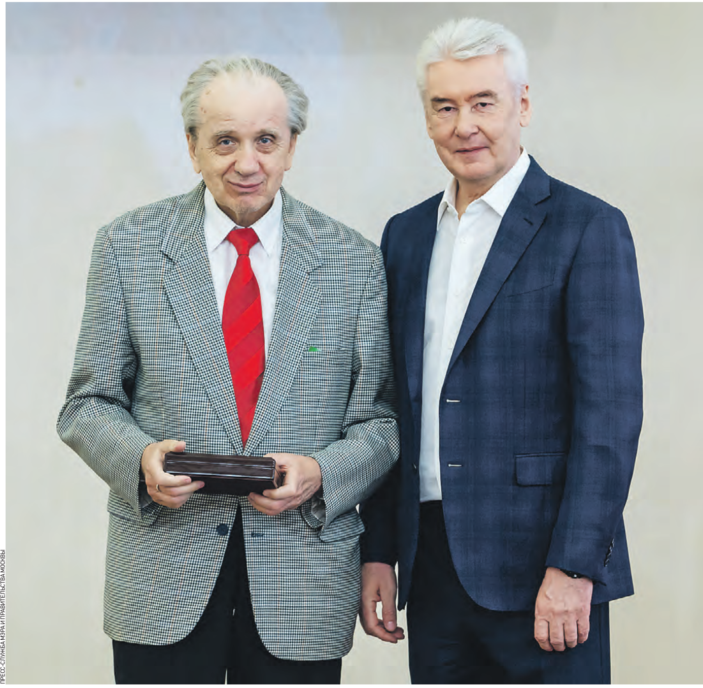
Вчера 13:17 Мэр Москвы Сергей Собянин (справа) вручил знак отличия «За безупречную службу городу Москве» артисту Театра имени Моссовета Евгению Стеблову. Многие его знают по постановке «Василий Теркин» и фильму «Я шагаю по Москве»

За большой вклад в развитие отечественной культуры и искусства орден «За заслуги перед Отечеством» II степени получил директор Московского театра «Ленком» Марк Варшавер. За безупречную службу в течение полувека знаком отличия награжден артист театра имени Моссовета Евгений Стеблов, которого многие знают по фильму «Я шагаю по Москве» и постановке «Василий Теркин». Актрисе этого же театра Екатерине Гусевой присвоили звание