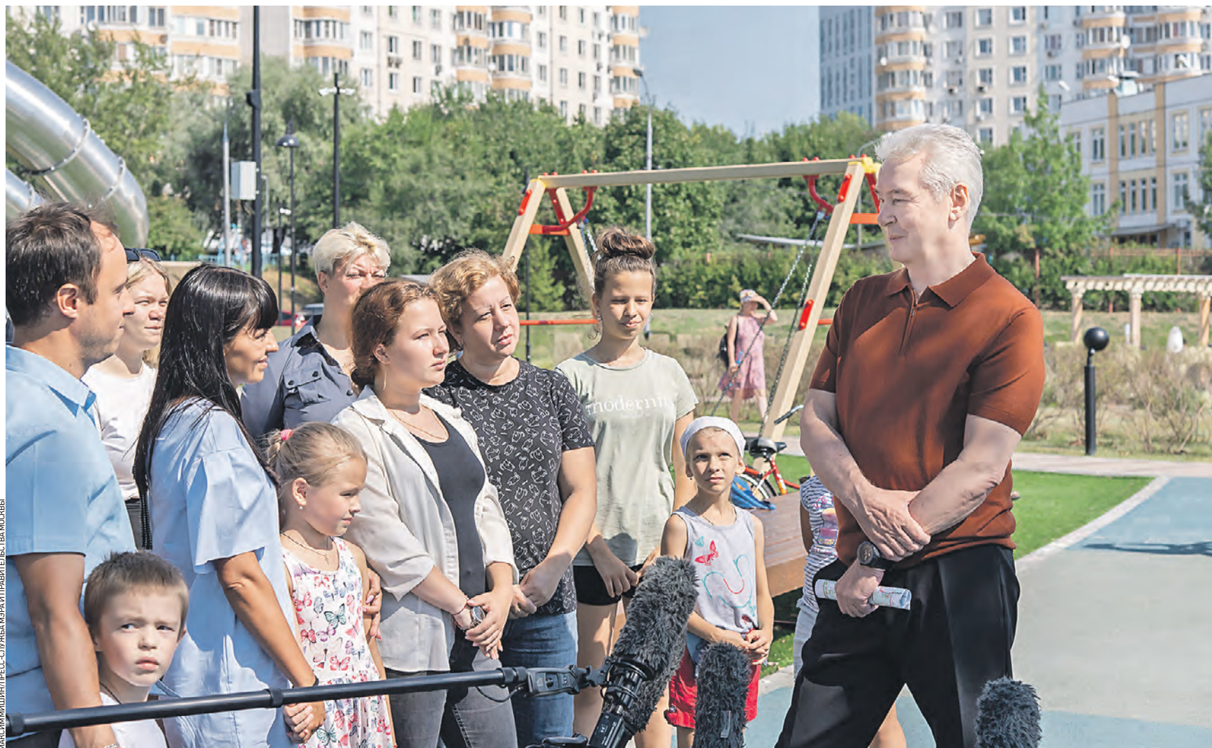
17 августа 2022 года. Мэр Москвы Сергей Собянин (справа) на встрече с жителями Москворечья-Сабурова, где прошло комплексное благоустройство территорий. За минувшие десять лет в столице обустроили более 24 тысяч дворов. В этом году в списке свыше 1,6 тысячи придомовых территорий

— На севере Москвы, в районе Сокол, обновим две большие дворовые территории в границах улиц Алабяна и Панфилова. Приведем в порядок четыре детские площадки, — сообщил Сергей Собянин. В Зеленограде продолжается благоустройство дворов в Савелках и Старом Крюкове. А во дворах на Кременчугской улице и Кутузовском проспекте