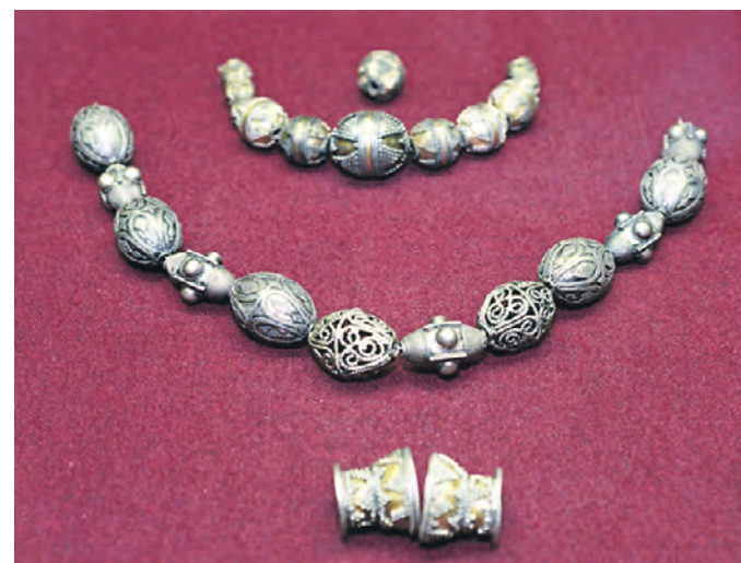
1 апреля 1999 года. Украшение из Большого Кремлевского клада, найденного в 1988 году у Спасских ворот