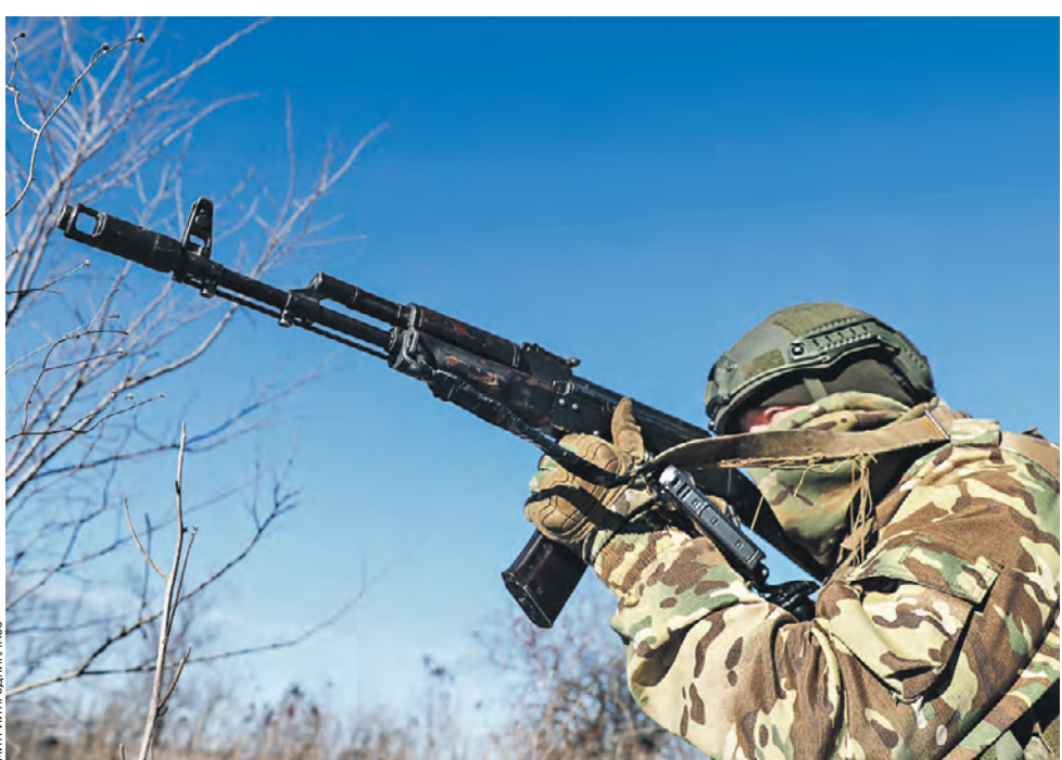
24 января. Военнослужащий инженерного подразделения первого армейского корпуса ВС РФ во время отработки действий тактической саперной группы на местности. Во время такой подготовки бойцы также тренируются продвигать проходы в инженерных заграждениях противника, захватывать вражеские позиции и в дальнейшем минировать их, а также успешно удерживать территории, взятые под контроль российских военнослужащих.