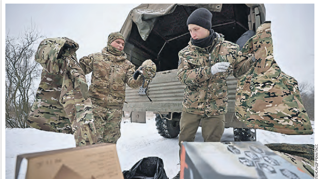
22 января. Волонтеры разгружают автомобиль с гуманитарной помощью от Общероссийского народного фронта для артиллерийского дивизиона Южной группировки войск

Вчера заместитель председателя Совета по правам человека при президенте России Ирина Киркоро заявила, что необходимо ввести единые правила доставки гуманитарной помощи в зону спецоперации.