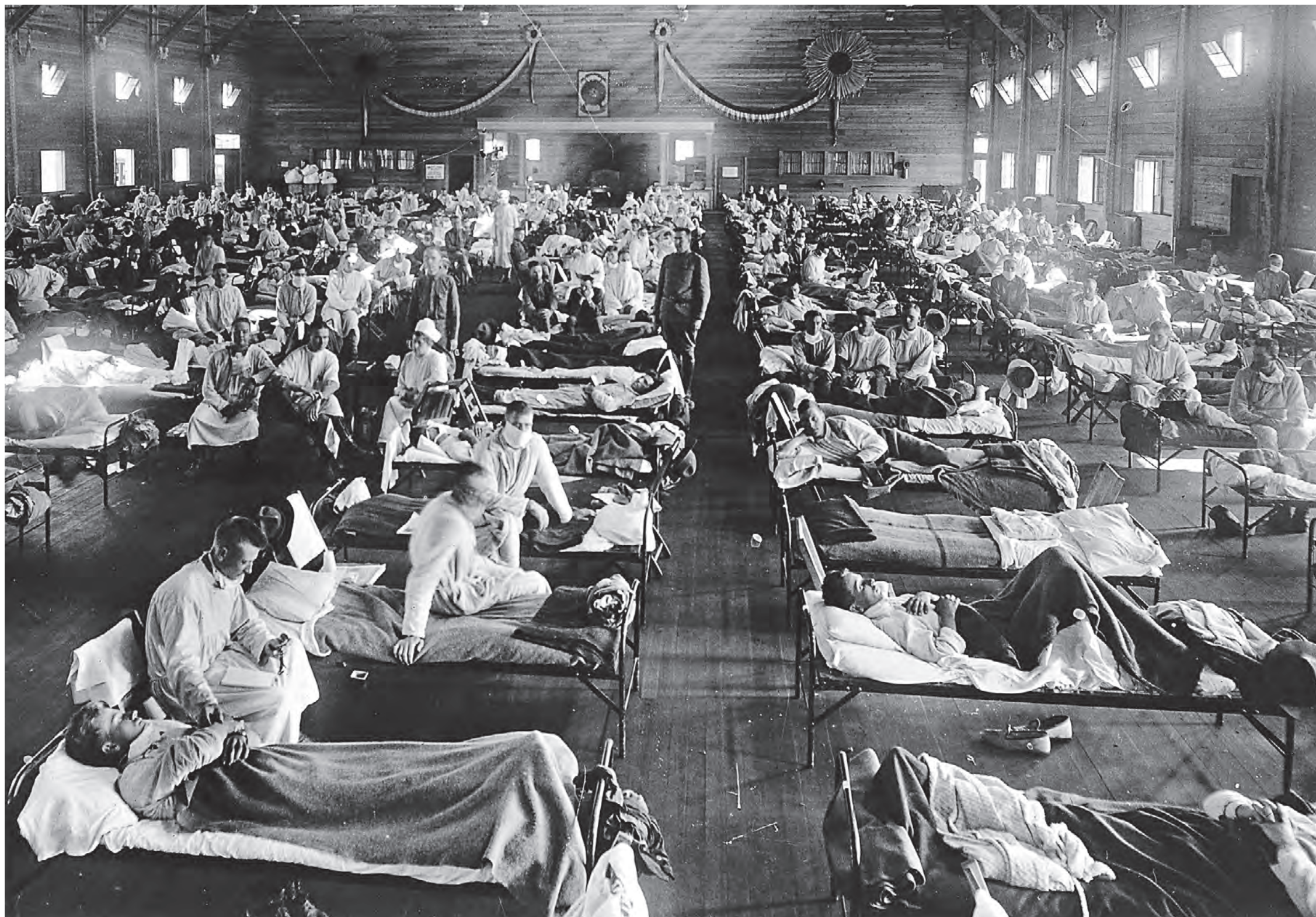
1918 год. Пациенты в больнице в Канзасе во время эпидемии испанского гриппа. Вирус поразил США, когда те участвовали в Первой мировой войне. Возбудитель заболевания завезли в Штаты через Атлантику на военных кораблях

Ученые выясняют, какой вирус может привести к новой пандемии