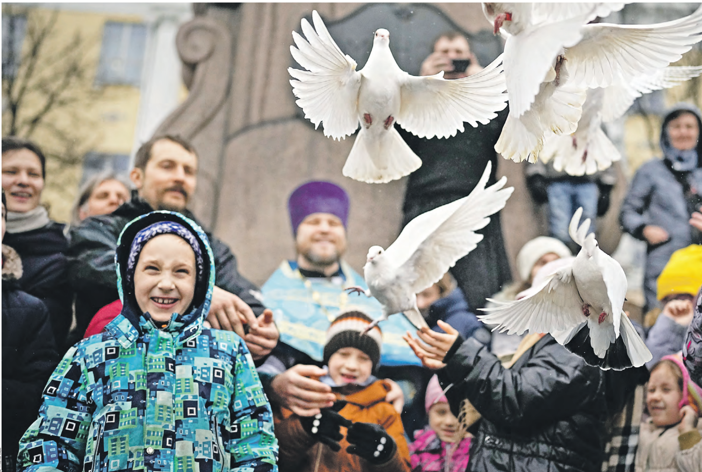
7 апреля 2022 года, Москва. Верующие у храма Христа Спасителя выпускают голубей в честь праздника Благовещения Пресвятой Богородицы

Почему же так произошло, по вашему мнению? Потому что они усматривали в грядущем коммунизме воплощение христианских нравов. Это не мои домыслы: в Москве того времени существовало ХББ: Христианское братство борьбы, это были православные социалисты, которые боролись за то, чтобы воцарился христианский, «коммунистический» общественный строй. Понимаю, ныне это звучит парадоксально, но тем не менее. Конечно, они не могли