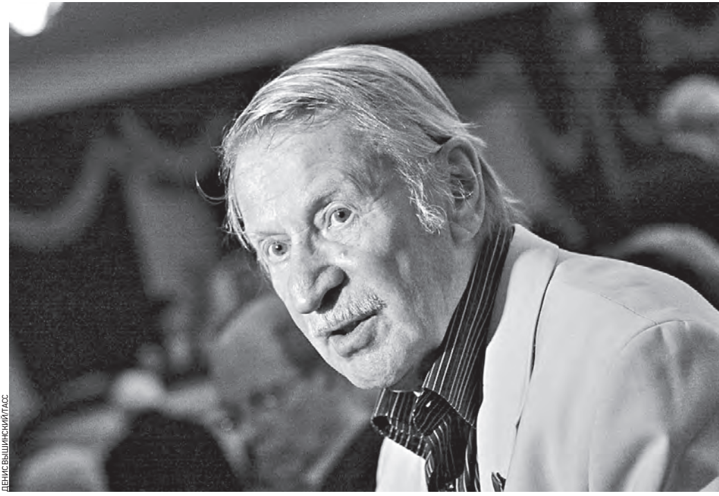
Актер Иван Краско на церемонии вручения 16-й театральной премии «Золотой софит» в Большом драматическом театре имени Г. А. Товстоногова. Фото 2010 года