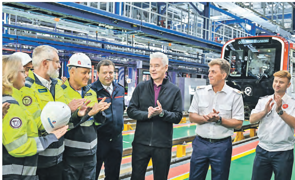
8 августа. Мэр Москвы Сергей Собянин (в центре) вместе со строителями и сотрудниками метро открыл первое на территории Новой Москвы электродорожку «Столбово»

дорожной сети в поселке Мострентен. Построили 6,2 километра дорог, включая три путепровода, обеспечили прямой съезд с Калужского шоссе к станциям метро «Корниловская» и «Тютчевская».