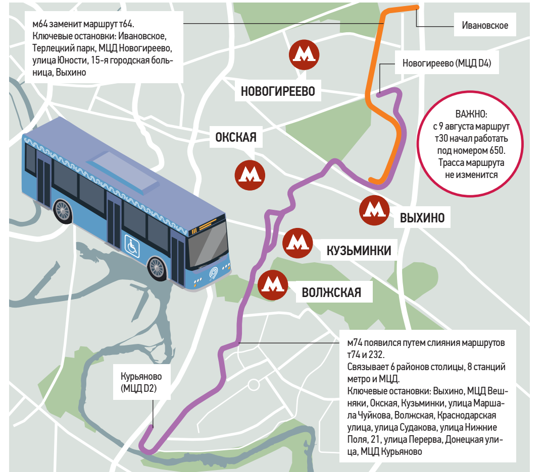
По данным Департамента транспорта и развития дорожно-транспортной инфраструктуры Москвы