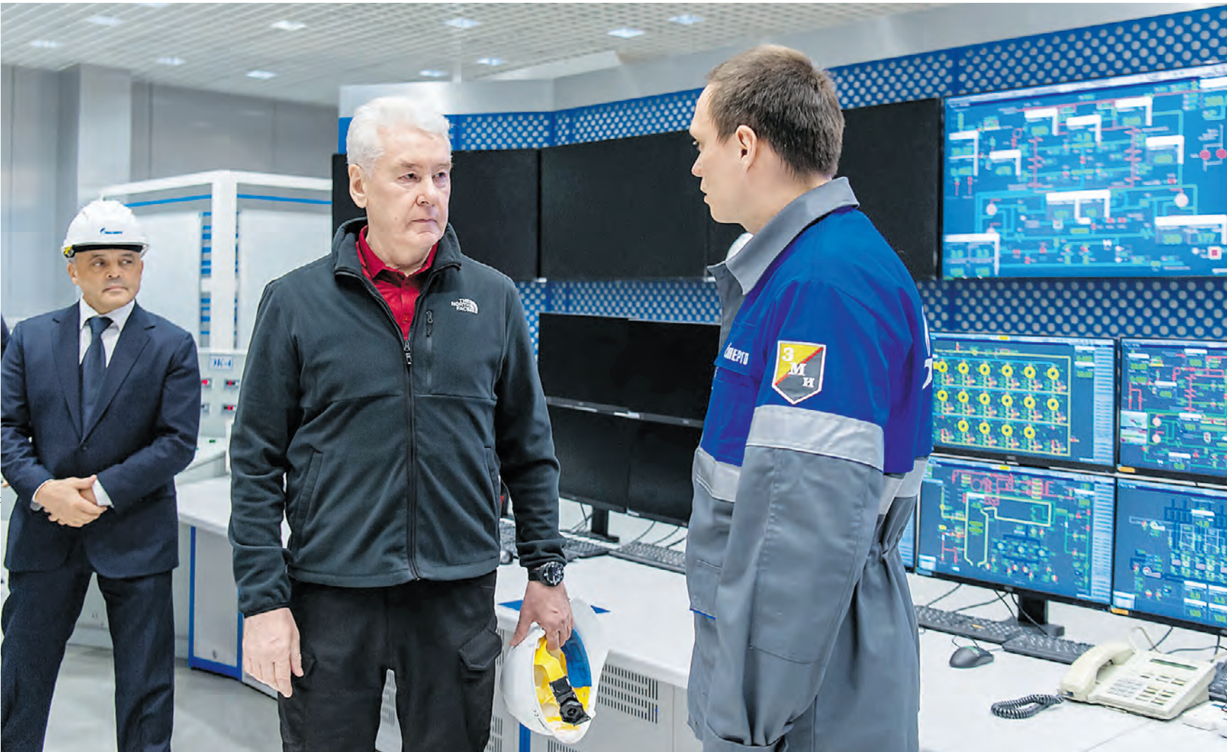
22 января 2024 года. Мэр Москвы Сергей Собянин (в центре) осматривает модернизируемую ТЭЦ-23 в районе Метрогородок. Сегодня, чтобы согреть москвичей, ежегодно требуется около 80 миллионов гигакалорий. Столько же потребляют некоторые государства

Одно из ключевых направлений работы Комплекса городского хозяйства Москвы — реализация программы капитального ремонта жилых домов. Программа стартовала в 2015 году. За это время уже отремонтировано 15,3 тысячи домов, из них 2482 — в прошлом году. В 2026 году планируется отремонтировать 1796 домов площадью 15,5 миллиона «квадратов». Кроме того, столица тщательно следит за состоянием лифтового хозяйства. В 2018 году в московских многоквартирных домах не осталось ни одного лифта старше 25 лет. В 2026 году планируется заменить 5574 лифта в 1594 домах. — Одна из основных задач — своевременная профилактика, ремонт и модернизация инженерных систем, — отметил Сергей Собянин. В этом году планируется реконструировать 439,6 километра линий электропереда-