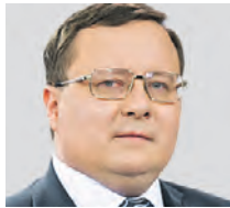
АЛЕКСАНДР РАЗУВАЕВ ЭКОНОМИСТ

Думаю, что люди пересмотрели свое отношение к финансовому вопросу. В современном мире они научились более грамотно расставлять приоритеты. Цены и правда растут, приходится искать выходы и на чем-то экономить. В нашем случае это сниженная статья расходов на вещи, которые покупают в секонд-хендах. С одной стороны, это говорит об осознанном потреблении, потому что можно покупать, например, подержанные детские вещи, из которых ребенок быстро вырастает. Можно приобрести их у других людей и продать, когда они перестанут быть нужными. Кроме того, в таких местах можно найти качественные и даже брендовые вещи по низкой цене. А с другой стороны, конечно, это говорит о финансовом положении россиян.