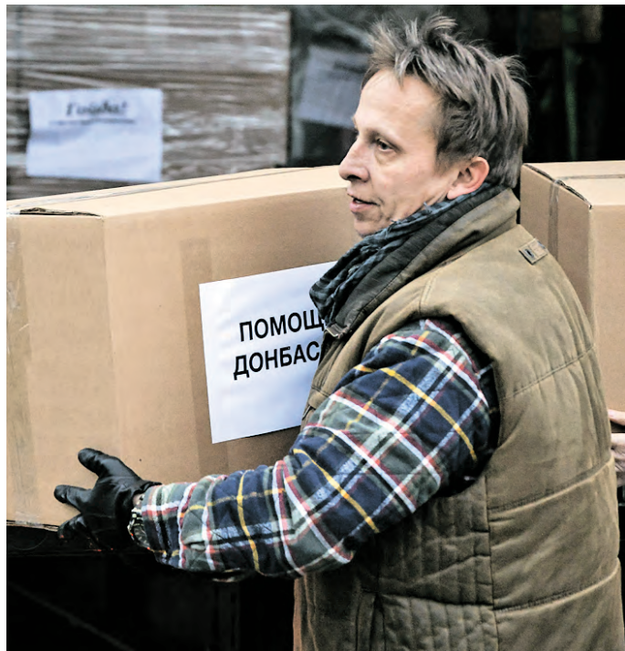
16 ноября 2022 года. Актер Иван Охлобыстин во время распределения гуманитарной помощи российским военнослужащим в Донецке

Победой на СВО Россия спасет мир от гибели. Это мое глубокое убеждение. Если хотите, я наслаждаюсь осознанием