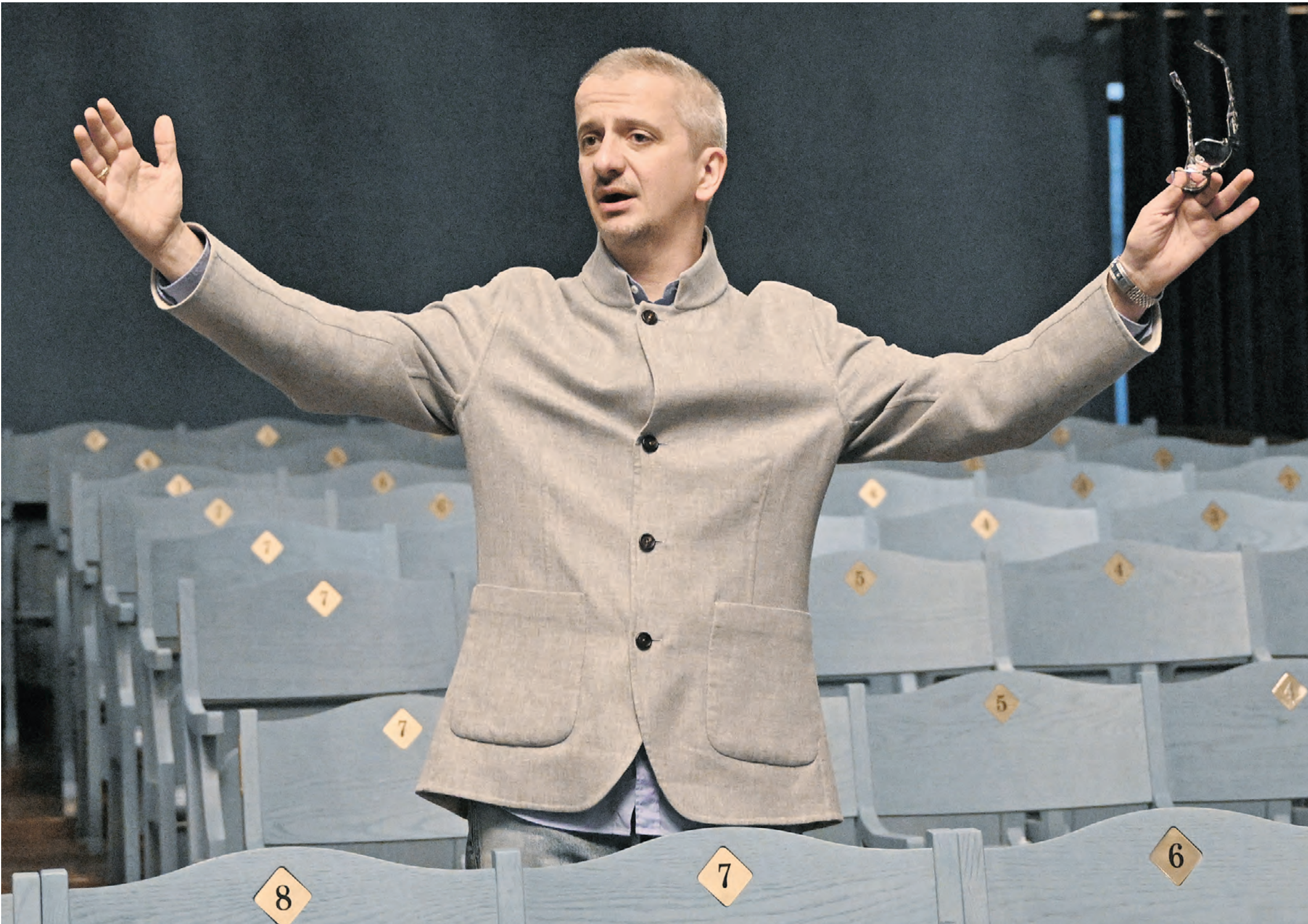
19 апреля 2025 года. Художественный руководитель Московского драматического театра на Малой Бронной Константин Богомолов отвечает на вопросы журналистов во время пресс-подхода в отреставрированном зрительном зале театра

Я не театровед, я медиаидеолог, и мне интересен Богомолов как генератор смыслов. У него я интересовался, действительно ли мой визави (Богомолов) настаивает на тезисе, что Европа обречена на приход нацистов в ряде стран? Ответ: «Никто ни на что не обречен. Я говорю о том, что Европа строит упрощенное общество, в котором людей натаскивают на