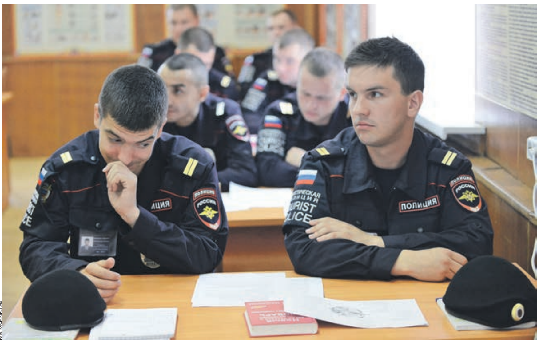
Вчера 9:15 База 3-го батальона 1-го оперативного полка, улица Викторенко, 10. Сотрудники туристической полиции внимательно слушают коллегу-инспектора, обладающего глубокими познаниями английского языка. Подобные занятия — повседневная практика для полицейских, несущих службу в историческом центре города

Туристическая полиция отмечает первый год службы