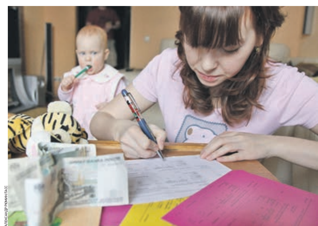
1 февраля 2014 года. Переход на новые приборы учета позволил жителям более точно рассчитывать расходы на электроэнергию. Так что новые тарифы на коммуналку рачительным владельцам не страшны

Тарифы на коммунальные услуги в Москве с 1 июля поднимутся на 10 процентов. Помимо этого, на 13 процентов подорожает отопление, на водоотведение и холодную воду тарифы поднимутся на 5,9 процента, на горячее водоснабжение — на 11,5 процента. Также от 7,5 до 13 процентов повысятся платежи за электроэнергию, на 7,5 процента — на газ.