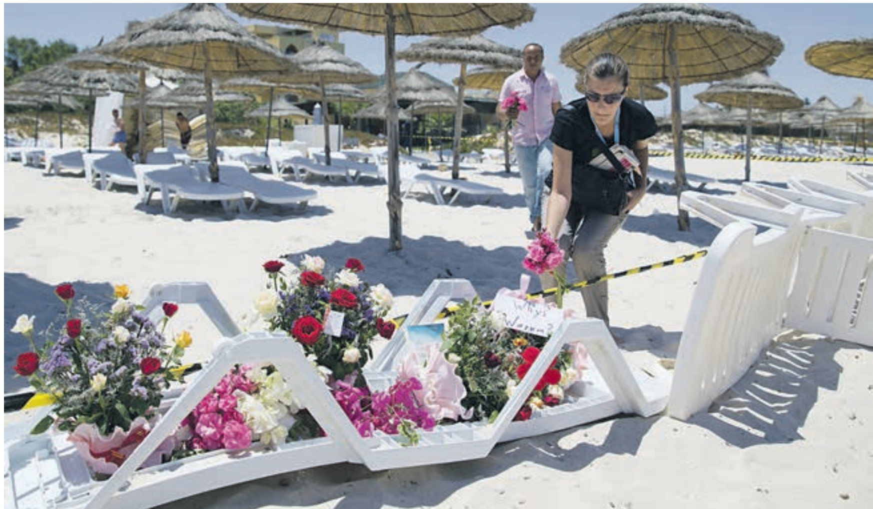
27 июня. Пляж отеля Riu Imperial Marhaba. Люди возлагают цветы на место, где террорист расстрелял из автомата безоружных туристов. Теперь, несмотря на наличие вооруженных до зубов полицейских и разгар сезона, пляжи Туниса пустеют. Туризмостроительная страна несет колоссальные убытки

Похоже, что весь средиземноморский регион перестает быть привлекательным для туристов. Из-за вопросов безопасности. Несмотря на невысокие цены, отдыхающие не очень-то торопятся поехать загорать на пляжи Египта.