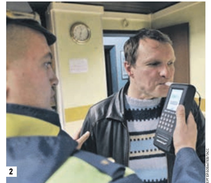
2 2 июня 09:40 Отправка детей в летний лагерь. Требования к перевозке организованных групп детей ужесточились (1) 20 октября 2012 года 00:35 Водитель проходит тест на алкоголь. С сегодняшнего дня за пьянство за рулем можно угодить в тюрьму (2)

В преддверии вступления в силу изменений в Правилах дорожного движения с сотрудниками ГИБДД были проведены необходимые дополнительные занятия в рамках служебной подготовки. Сотрудники Госавтоинспекции Москвы необходимыми багаж знаний имеют и готовы к выполнению государственных функций по контролю за дорожным движением. Мы настоятельно рекомендуем всем участникам дорожного движения ознакомиться с произошедшими изменениями в ПДД на сайте Госавтоинспекции: gibdd.ru.