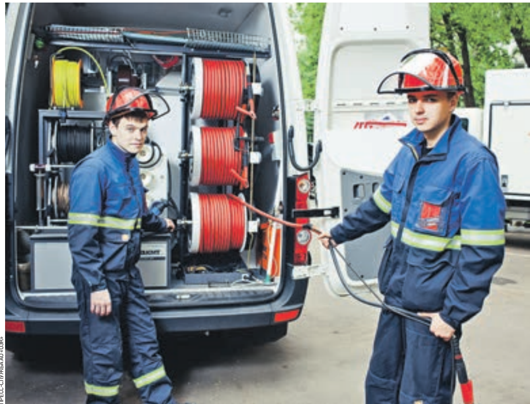
На стажировку в Объединенную энергетическую компанию хотят попасть студенты многих вузов

студентов, предпочитая кандидатов с опытом, и многие студенты, получив диплом, оказываются в подвешенном состоянии. Между тем в последнее время подобная ситуация начинает меняться, и работодатели все чаще обращают внимание на перспективных выпускников, давая им возможность не только получить представление о будущей специальности, но и получить первую запись в трудовой книжке. Одним из таких организаций является АО «Объединенная энергетическая компания». На сегодняшний день АО «ОЭК» входит в число крупнейших организаций на энергетическом рынке столицы. Стоит ли говорить, что студенты со всей страны стараются попасть сюда на стажировку? Это не только возможность применить теорию на практике, узнать что-