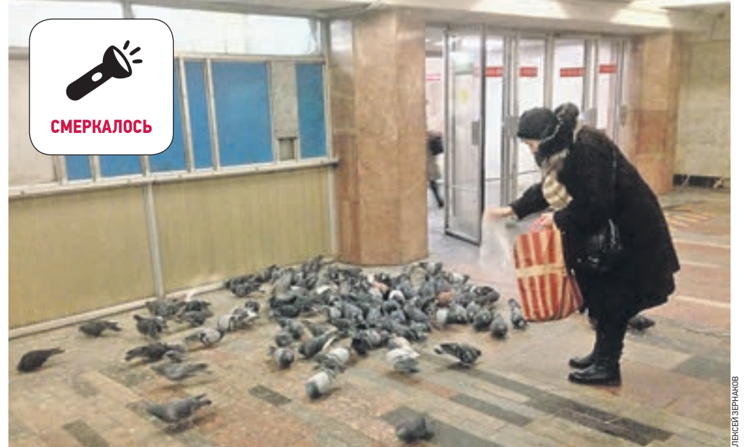
Вчера 18:35 станция метро «Китай-город». Уже более сотни пернатых спрятались от дождя под землей. Пассажиры с удовольствием подкармливают их. А некоторые специально привозят с собой целые сумки хлеба. Впрочем, работники, содержащие подземный переход в порядке, недовольны вынужденным соседством: уж очень много мусора оставляют после себя пернатые постояльцы.