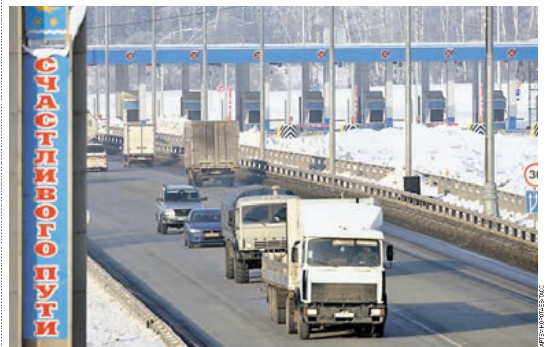
18 января 14:15 Контрольный пункт взимания платы на 93 километре трассы М-4 «Дон». С середины мая 2015 года платный участок работал в тестовом режиме. Позавчера в действие введены тарифы на проезд