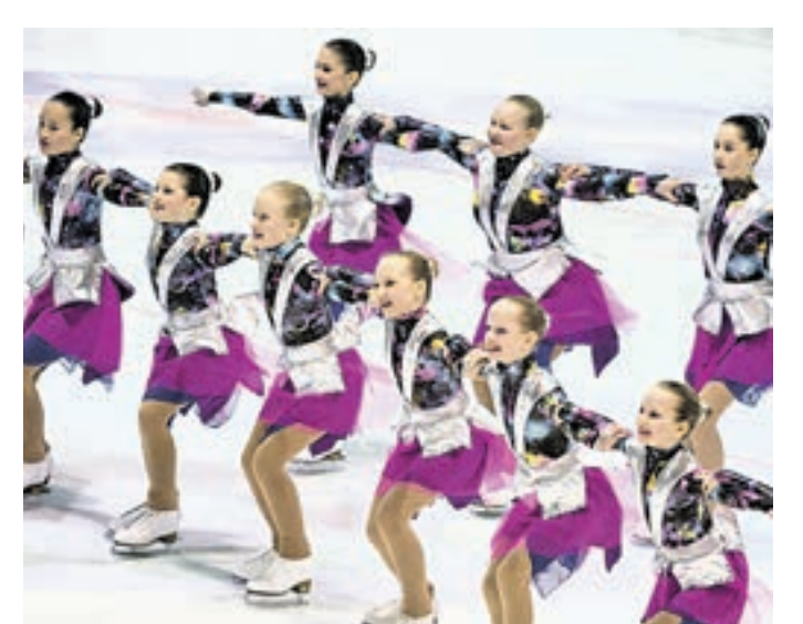
14 ноября 2015 года 17:25 Юные фигуристки финского спортивного клуба HSK исполняют групповой номер в ледовом дворце в Хельсинки

одоления собственных слабостей. Выходцы из школы русских коньков отличаются именно умением преодолевать трудности. Это главный плюс? У наших ребят очень хорошо поставлена техника, психология, у большинства тренеров — профессиональное медицинское образование. Дело в том, что в Советском Союзе, а затем и в России, в отличие от большинства других стран, спорту обучают профессионально. Тренер хорошо знает анатомию и физиологию человека, имеет необходимые медицинские навыки. Грамотный тренер должен и подбодрить своего ученика, но он же должен понять, когда надо сказать «стоп», чтобы избежать травмы или переутомления. И наши тренеры отлично это умеют. И мне жаль, что Россия в последние годы потеряла много действительно профессиональных тренеров. Теперь их успехи будут связаны с другими странами.