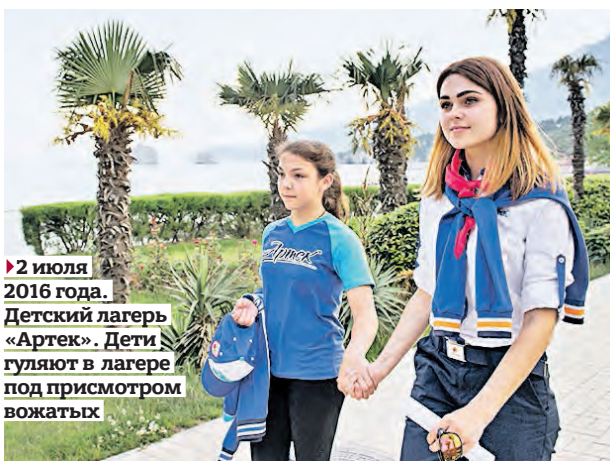
■ 2 июля 2016 года. Детский лагерь «Артек». Дети гуляют в лагере под присмотром вожатых

Московские власти в 2017 году изменили порядок предоставления бесплатных путевок для отдыха и оздоровления детей-льготников. На первом этапе родителям предстоит написать заявление в Мосгортур с указанием приоритетных мест и времени отдыха. Второй этап предполагает выбор конкретных организаций, путевок в которые закуплены. — Если на втором этапе заявителя не устроят предложенные Мосгортуром организации, есть воз-