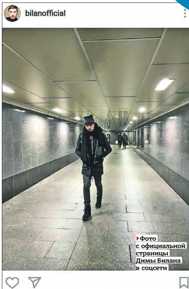
► Фото с официальной страницы Димы Билана в соцсети

На видео певец идет по спускающемуся эскалатору в обратном направлении. Подпись к кадрам: «Погодите, а это в какую сторону, а?» Очевидная шутка артиста вызвала неоднозначную реакцию публики. Фанаты писали, что певец напоминает человека «без определенного места жительства». Многие также отметили, что Дима изрядно похудел, и всерьез беспокоились о состоянии его здоровья. Впрочем, победитель «Евровидения-2008» уже вы-