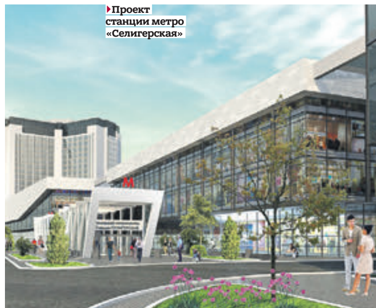
► Проект станции метро «Селигерская»