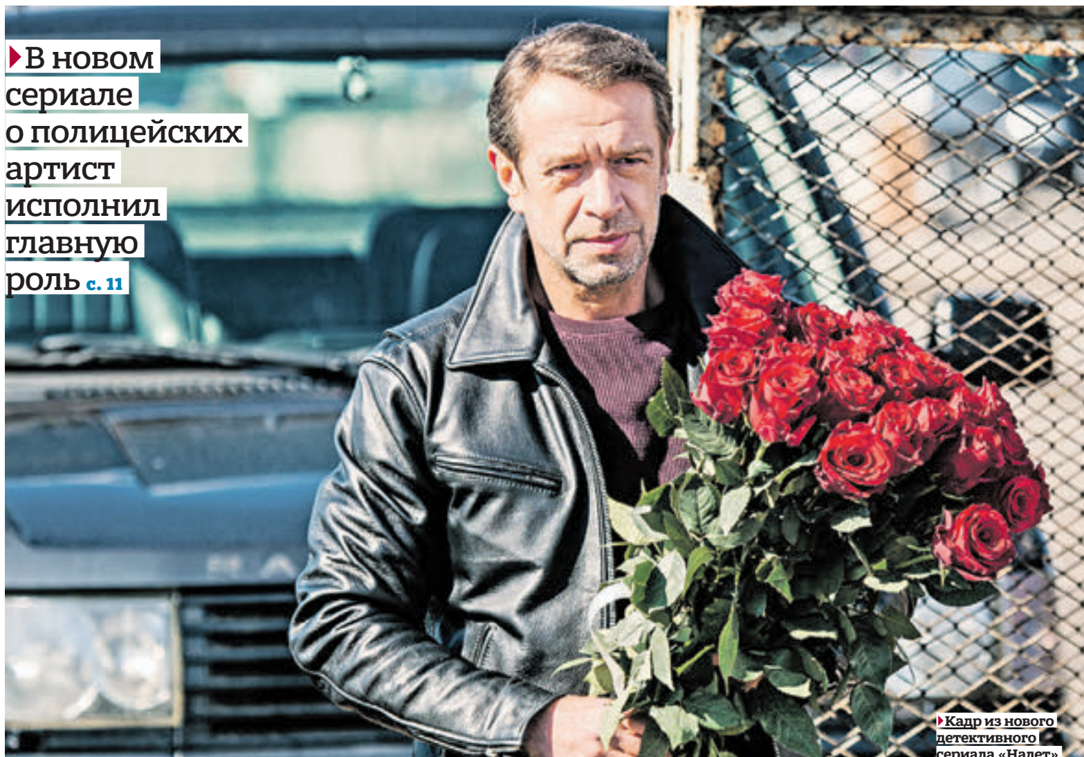
Кадр из нового детективного сериала «Налет»

▶ В новом сериале о полицейских артист исполнил главную роль с. 11