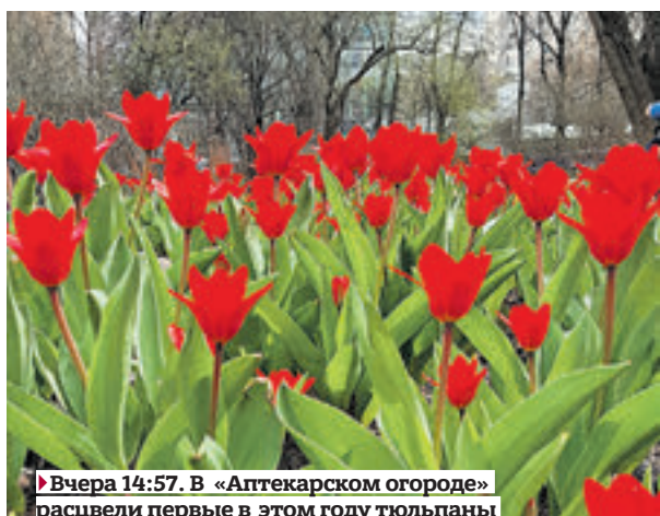
► Вчера 14:57. В «Аптекарьском огороде» расцвели первые в этом году тюльпаны