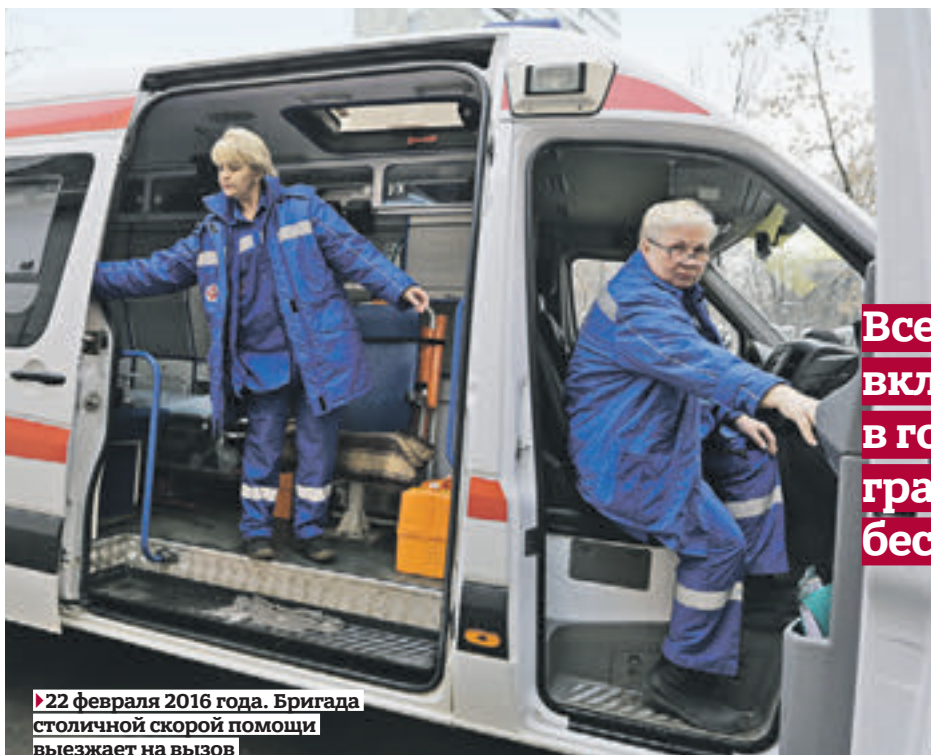
► 22 февраля 2016 года. Бригада столичной скорой помощи выезжает на вызов

Медики перехватывают больных друг у друга