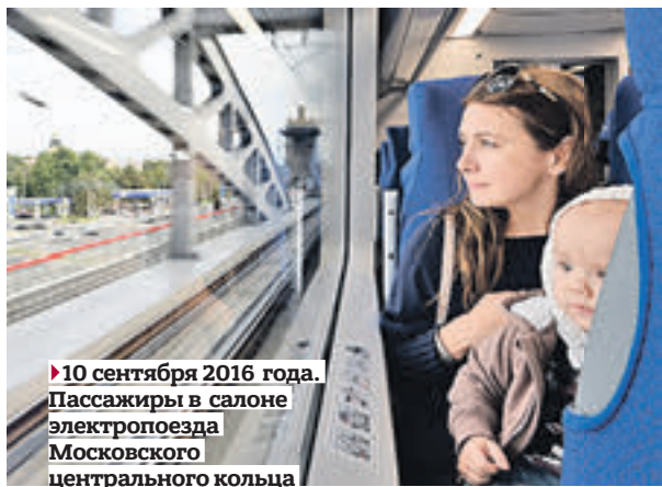
► 10 сентября 2016 года. Пассажиры в салоне электропоезда Московского центрального кольца