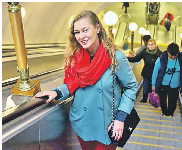
16 апреля 2018 года. В праздничные дни график работы некоторых станций будет изменен