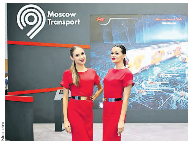
23 апреля 2018 года. Стенд Московского метрополитена на международном Транспортном конгрессе в Дубае