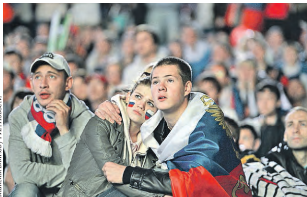
17 июня 2012 года. Болельщики российской сборной наблюдают за матчем в фан-зоне на Воробьевых горах