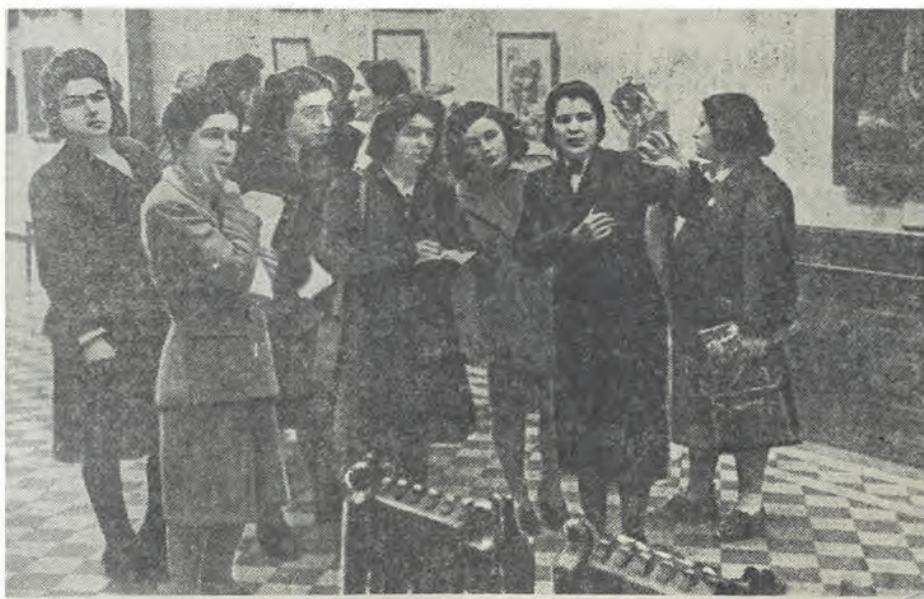
Привезшая в Москву делегация французских женщин посетила Государственную ГА СНИМКА: французские женщины в одном из залов галлерей.