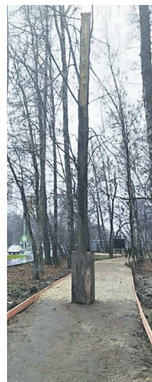
5 ноября 2019 года. Дерево посреди дороги в парке

■ На севере Москвы благоустраивают природную территорию. Даже в такой рациональной работе есть место креативу, доказывают кадры из соцсетей.