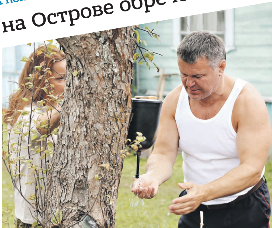
Алена Лисовская и Олег Тактаров в новом детективном сериале «Остров обреченных». Тактаров играет участкового майора Прохина

Ну а самое удивительное — драгоценности на убитой девушке раньше принадлежали дочери генерала Павлова, а она исчезла восемь лет назад. Вот так начинается детектив «Остров обреченных», премьера которого ждет вас