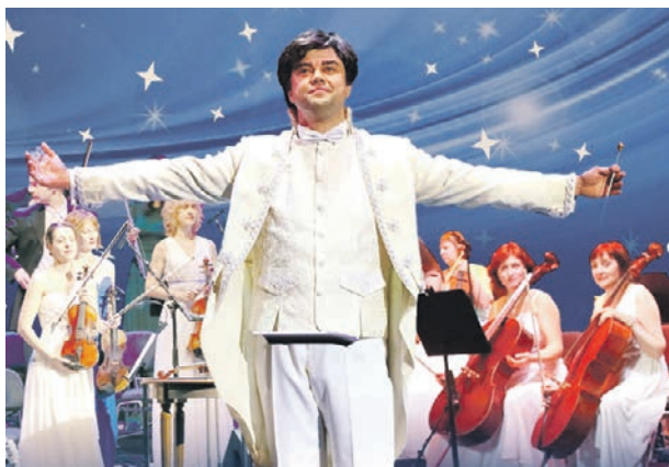
На переднем плане худрук и главный дирижер оркестра Concord Orchestra Fabio Pirola

шоу в канун Нового года. «Белоснежный бал Йоганна Штрауса». Вальсы венского композитора многие считают эталоном танцевальной музыки, которые исполняют на новогодних балах во всем мире. 28 декабря в Государственном Кремлевском дворце прозвучат самые популяр-