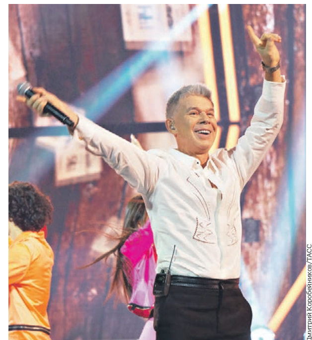
Олег Газманов выступал на «Ээхх, разгуляй!» в прошлом году и в этом вновь порадует поклонников