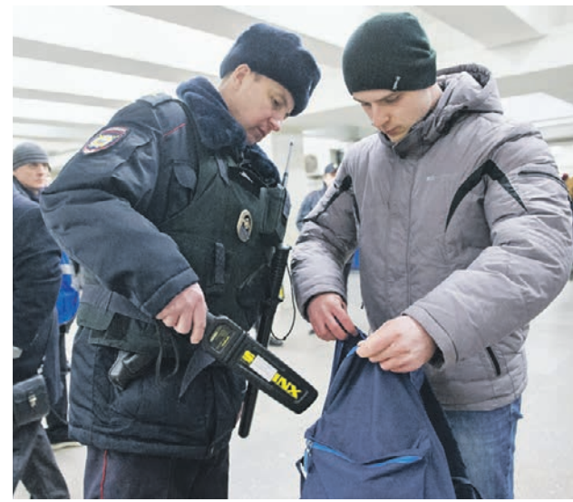
Полицейские Управления внутренних дел на Московском метрополитене всегда на страже безопасности