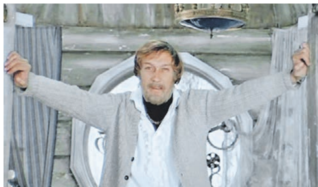
1978 год. О. Янковский в фильме «Обыкновенное чудо»

пустоты. Он был слишком талантлив, чтобы все оборвалось так рано... Олег Янковский сыграл огромное количество ролей, но в его жизни был и очень сложный период неуспеха и не востребоваемости. А знаете ли вы, что Янковский чуть не остался за гра-