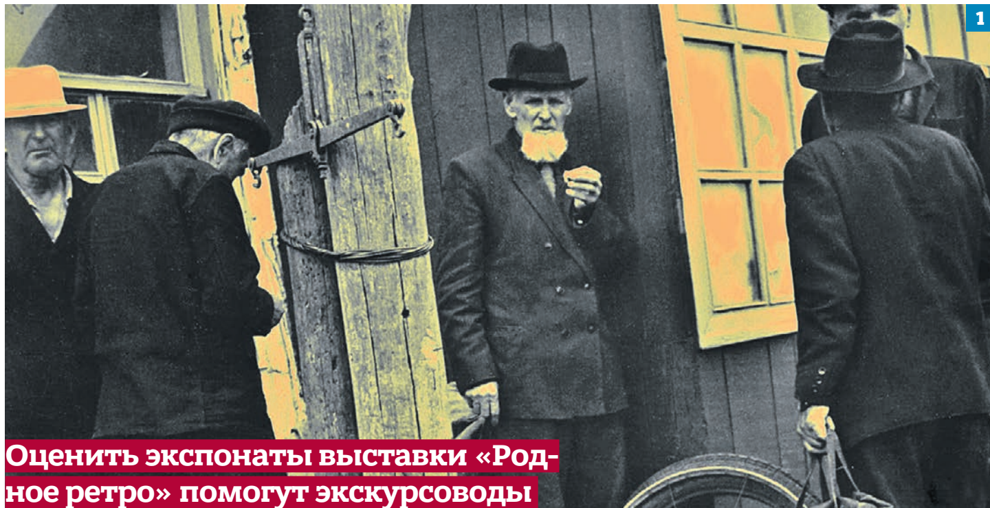
Оценить экспонаты выставки «Родное ретро» помогут экскурсоводы