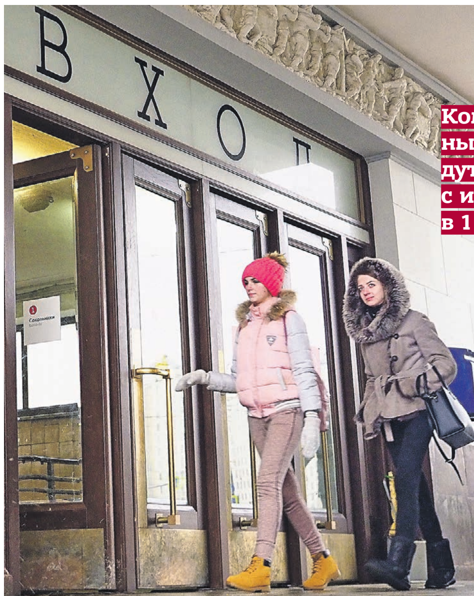
4 февраля 2019 года. Вход в вестибюль станции метро «Сокольники»

Пять станций Сокольнической линии закроют на неделю