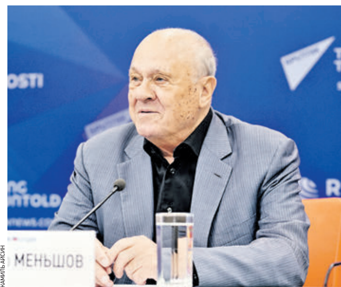
Вчера 12:25 Режиссер Владимир Меньшов с теплою вспоминает годы, отданные ВГИКу

В начале беседы Владимир Меньшов рассказал, какую роль сыграли в его жизни кинематограф и ВГИК. — Вся соблазнительная жизнь была понята через кино, — вспоминал кинематографист. — Я очень любил творчество Николая Рыбникова: «Весна на Заречной улице» на меня произвела неизгладимое впечатление. В Москву я приехал, не понимая, что надо стихи читать, думать, надо прогуливаться перед камерой, и она решит, годишься или нет. Но мне удалось пройти консультацию и получить место в общежитии. Это оказалось роковым — неделю перед первым туром я жил и питался в этой атмосферной. Я просто задохнулся от счастья и понял, что не буду больше нигде пробовать поступить. Режиссер рассказал о том, как проходит прием в его мастерскую: перед тем как допустить к вступительным испытаниям, комиссия оценивает творческое задание, так что на экзаменах конкурс был уже не такой фантастический. В этом году в мастерскую Меньшова поступили тридцать человек.