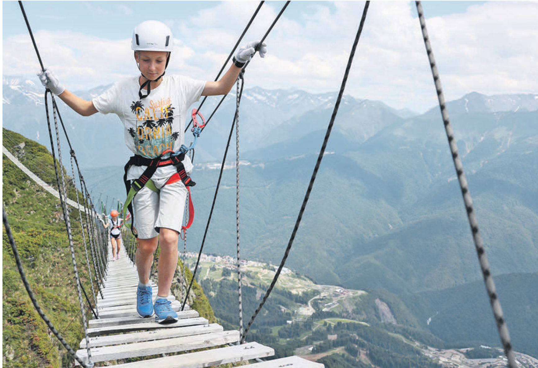
19 июня 2019 года. Россия. Сочи. Дети во время прохождения по подвесному мосту на территории горнолыжного курорта «Роза Хутор». Краснодарский край вне зависимости от сезона лидирует в списке самых популярных направлений среди столичных туристов