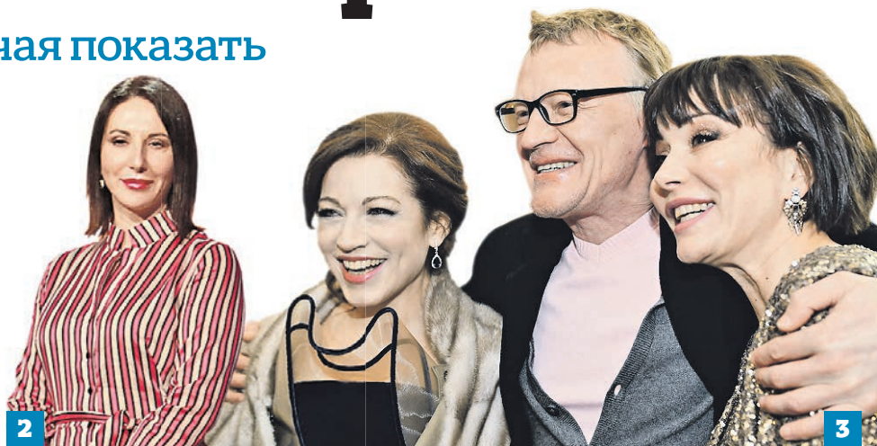
30 марта 2019 года. Актриса Ирина Горбачева с премией «Ника» (1), Алика Смехова (2), Алена Хмельницкая, Алексей Серебряков и Екатерина Семенова (3; слева направо), Екатерина Гусева (4)

ного покроя цвета мокрого асфальта. Под блестящий струящийся жакет артистка надела сдержанный топ черного цвета. Не оставили равнодушной пайетки и актрису Елену Кореневу. Она получила свою «Нику» за лучшую роль второго плана в маленьком черном платье с накладными карманами по линии бедра. А вот актриса Ирина Горбачева (она получала «Нику» вместо отсутствующей на церемонии