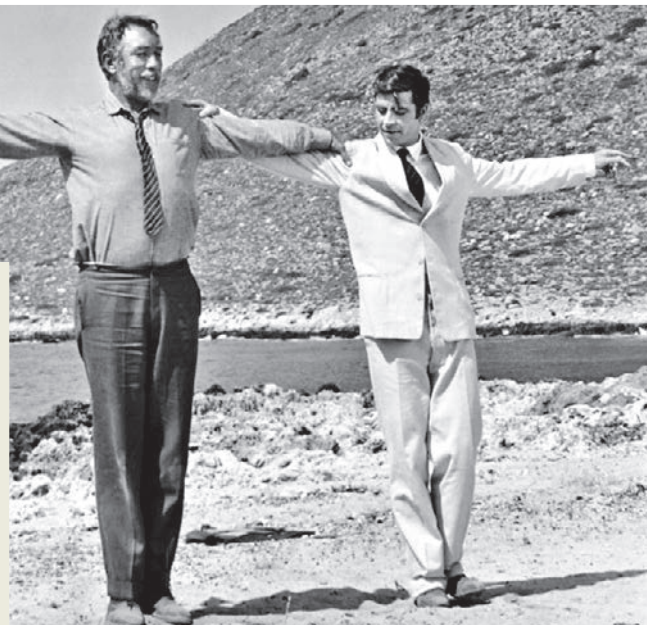
Кадр из фильма «Грек Зорба» (1964). Танец сиртаки был придуман специально для этого эпизода

Я рекомендую эту книгу всем, кто хочет получить хорошее чтение, заряжающее бодростью. Всем, кого угнетает нынешнее, серенькое на творчество время. Всем, кто хочет открыть для себя