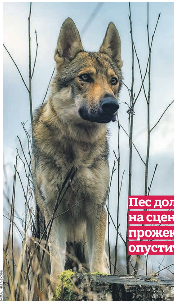
МХАТ им. Горького

Правда ли гонорар собаки-артиста выше, чем у Бузовой?