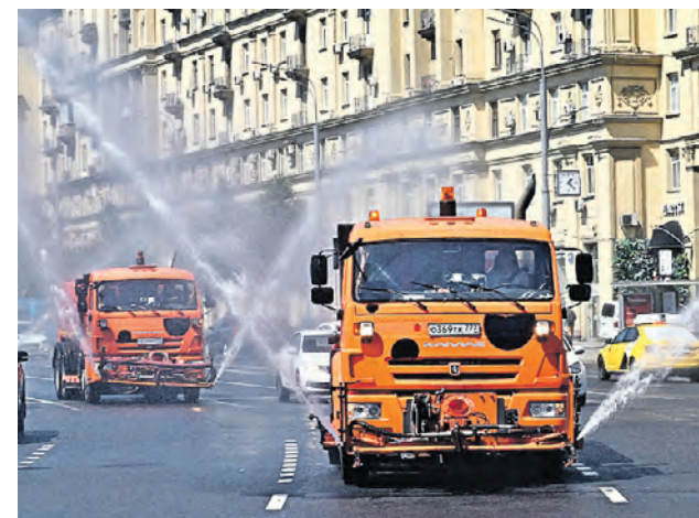
20 июня 2022 года. Коммунальные службы проводят аэрацию в центре города