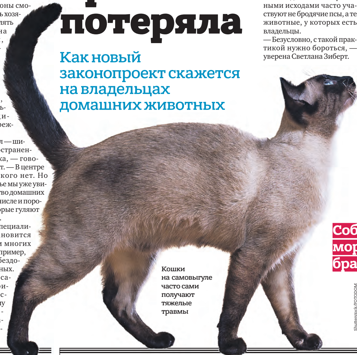
Кошки на самовыгуле часто сами получают тяжелые травмы

Как новый законопроект скажется на владельцах домашних животных