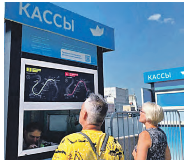
Жители города покупают билеты в кассе «Суда сюда!», которая начала работать на Устьинском причале