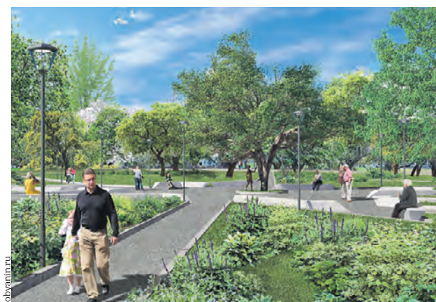
Проект реконструкции парка «Печатники», который планируют открыть в августе

Подготовил Никита Бессарабов vecher@vm.ru