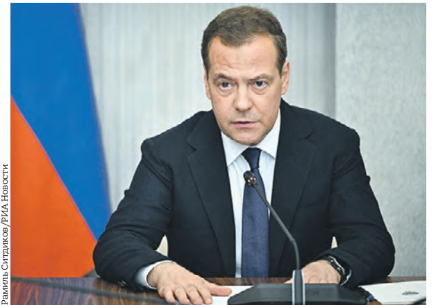
Заместитель председателя Совета безопасности РФ Дмитрий Медведев активно пользуется соцсетями

■ Вчера на официальной странице одной из социальных сетей зампреда Совета безопасности РФ Дмитрия Медведева был опубликован пост, который оказался фальшивым.