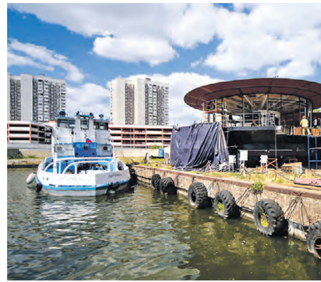
2 августа 2022 года. Строительство инновационных причалов для электрических речных трамваев в Москве