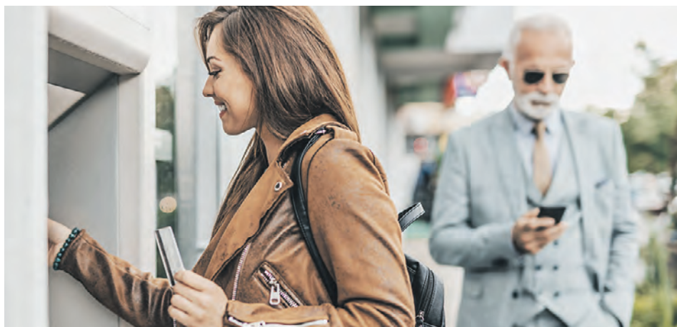
Россиянам рекомендуют снять деньги в банкомате и положить их на рублевый депозит

— За последний год инфляция составила более 15 процентов годовых. Между тем многие москвичи хранят свои сбережения на дебетовых банковских картах. На каких-то из них начисляется процент на остаток — порой до 10 процентов годовых, на