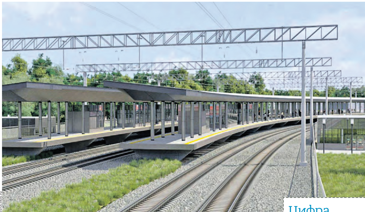
Проект реконструкции станции Лесной городок четвертого маршрута Московского центрального диаметра

Реконструкцию станции Лесной городок планируют завершить до конца года