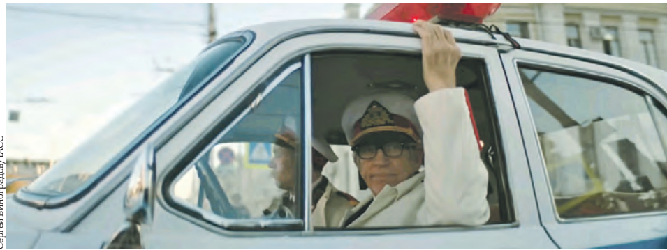
В съемках фильма «Брат-3» принял участие американский актер Эрик Робертс

Режиссер нового фильма раскрыл «МВ» детали сюжета