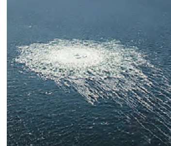
Место утечки газа на газопроводе «Северный поток 2» в водах Дании рядом с островом Борнхольм

Сеймур Херш обнародовал подробности подрыва «Северных потоков»