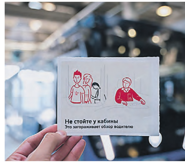
Образец наклеек, которые разъясняют пассажирам основные правила поведения в городском транспорте