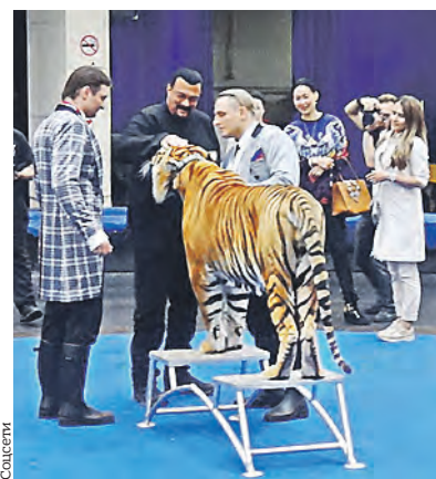
Стивен Сигал (в центре), братья Запашные и тигр по кличке Стивен

■ Катался в валенках по льду. Среди увлечений Аскольда Запашного особое место занимает хоккей. Он дружит с Александром Овечкиным и другими известными хоккеистами. Выступал в Ночной лиге с Александром Лукашенко, в команде звезд «КомАр». В детстве у будущего дрессировщика коньков не было, он мечтал о них, выходя в валенках на лед. А через много лет на гастролях Аскольд по приглашению друзей попробовал сыграть в хоккей — и его «затянуло». Амглула Запашного — основной защитник. Еще ему довелось выступать как фигуристу — в шоу «Ледниковый период», в паре с чемпионкой мира Марией Петровой.