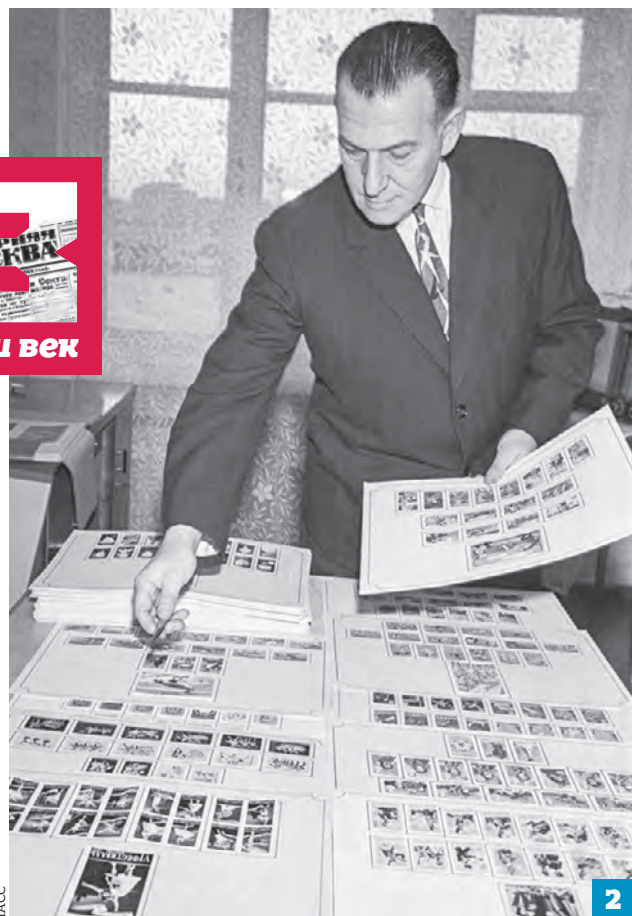
В СССР были популярны газовые зажигалки «Огонек» (1). 1965 год. Филателист систематизирует свою коллекцию марок (2)

подумать и одну из мастерских «Металлоремонта» предназначить для этой цели». Вопрос рубрики «Долго ли ждать?» оставался без ответа.