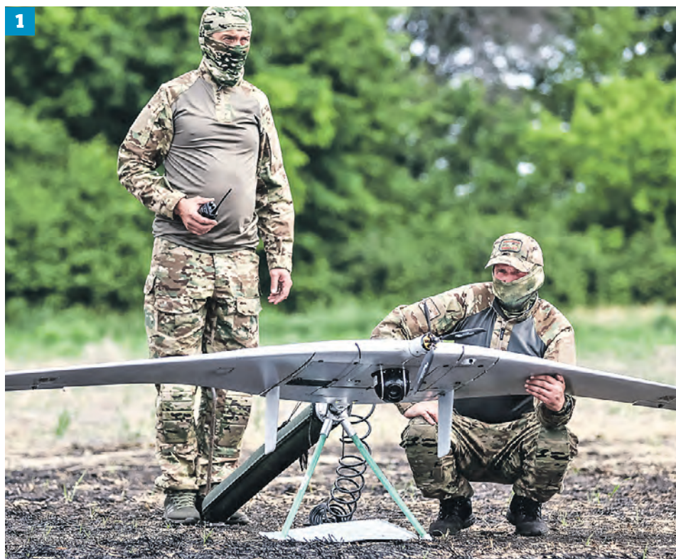
8 июня 2023 года. Военнослужащие во время работы расчетов БПЛА «Суперкам» (1). 12 июня 2023 года. Волонтеры предлагают москвичам записаться добровольцами (2)