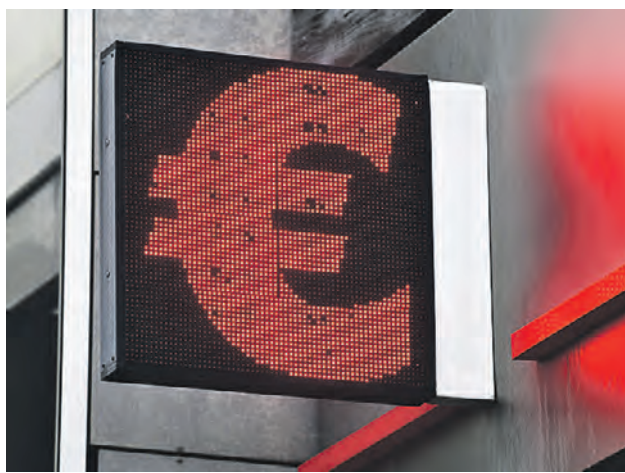
Курс евро пока что не стремится опускаться: вчера он составил почти 92 рубля

— Если экспорт из России будет расти быстрее, чем импорт, то рубль будет укрепляться. Ведь тогда валюты в России станет много, а зна-