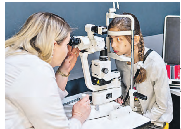
19 июня 2023 года. Врач филиала № 2 детской городской поликлиники № 91 проводит осмотр