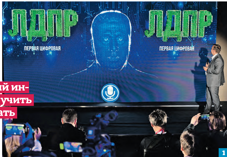
15 июня 2023 года. На экономическом форуме в Петербурге представили нейросеть «Жириновский» (1), которая дала прогнозы в манере Владимира Вольфовича (2)

Нейросеть обрела ход мыслей, а также манеру речи политика