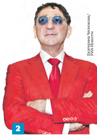
Екатерина Чеснокова/ РИА Новости

25 мая 2023 года. Уничтоженная БМП ВСУ на артемовском направлении (1). Григорий Лепс (2)